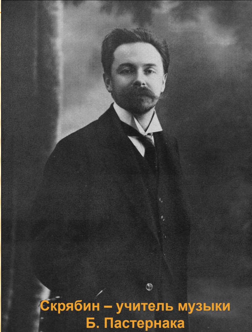
Скрябин – учитель музыки Б. Пастернака