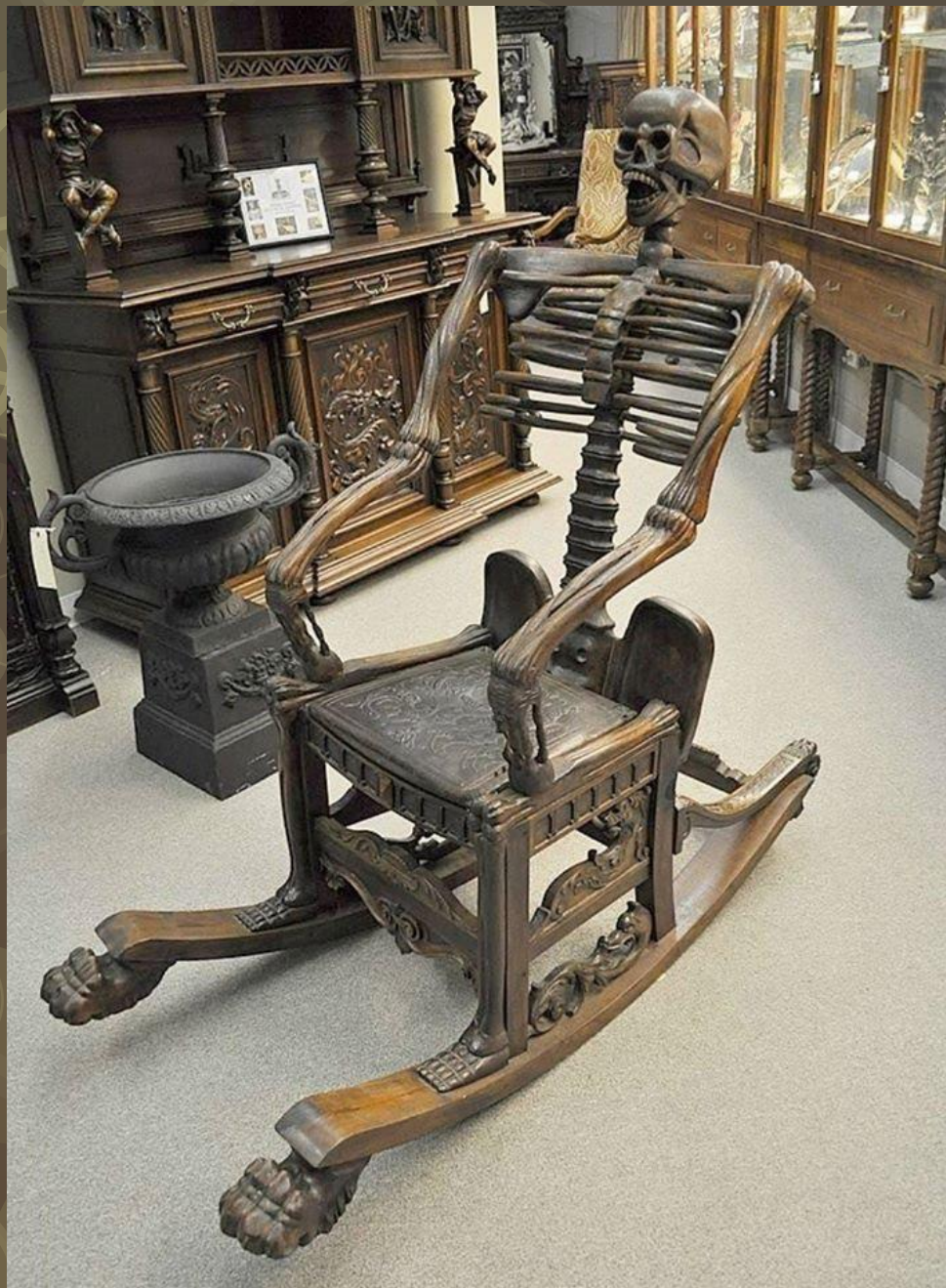
□ Чудернацька гойдалка