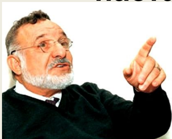
Ицхак Калдерон Адизес