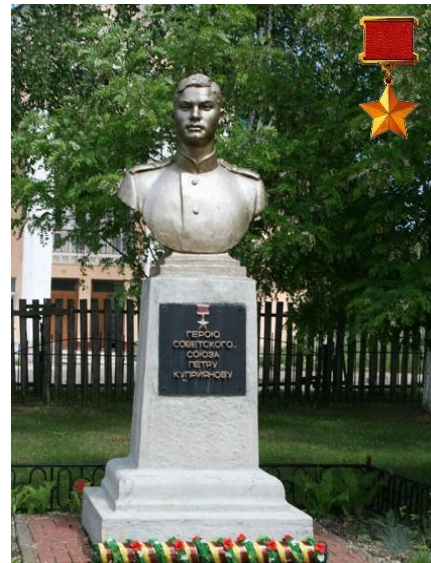
Памятник Петру Куприянову в Жодино