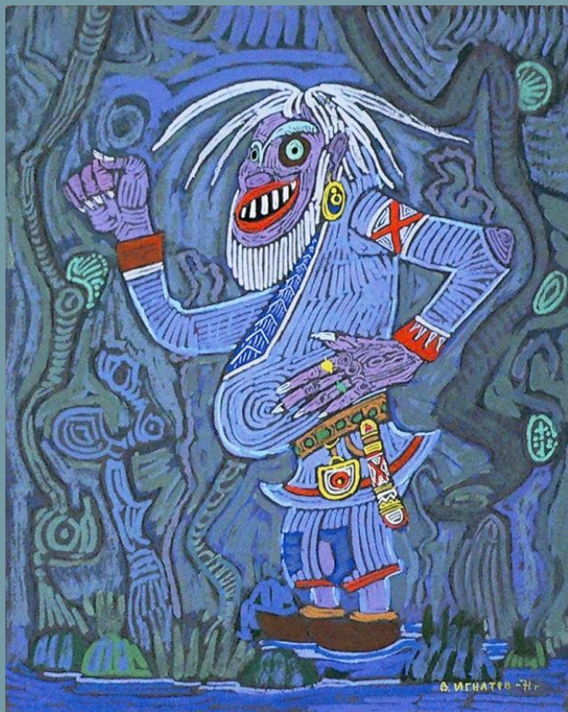
Яг- морт Ворса