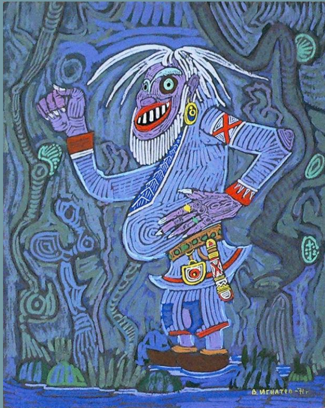
Яг- морт Ворса