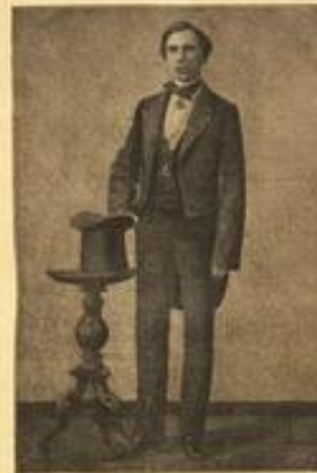
Иванъ Дмитриевичъ Путилинъ въ молодости.