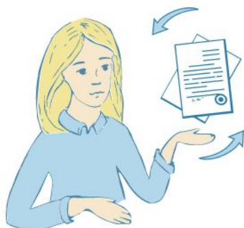
Узнать номер сертификата