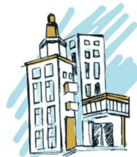
Вход для организаций