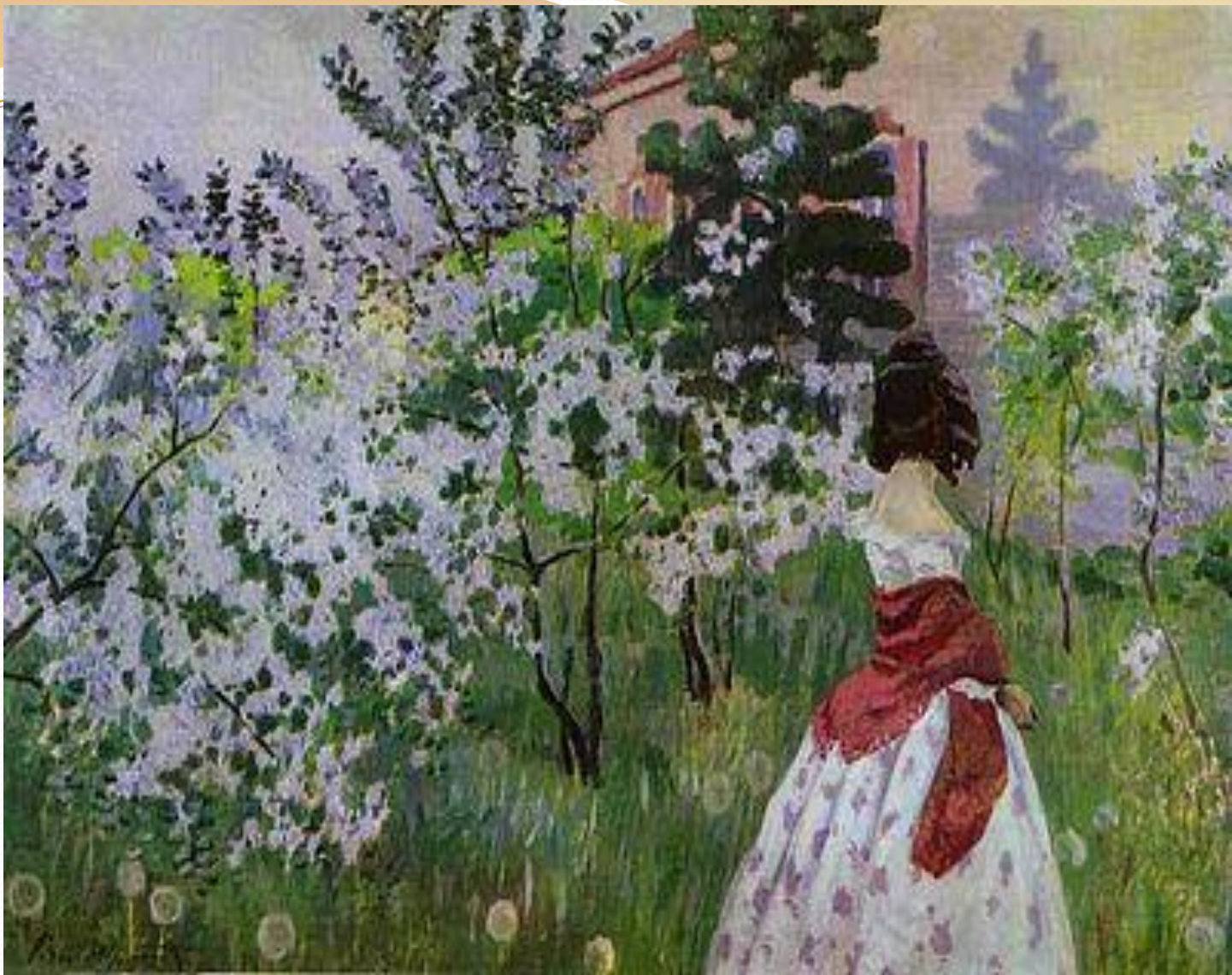
« Весна »