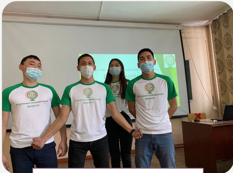
«День открытых дверей»