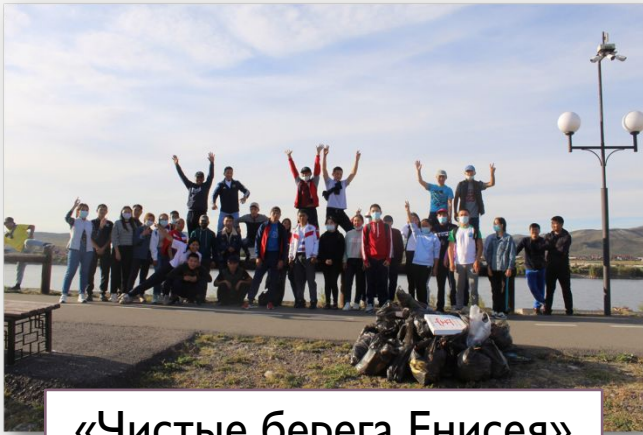
«Чистые берега Енисея»