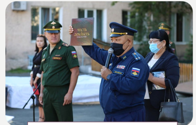
«1 сентября» (2020-2021 гг.)