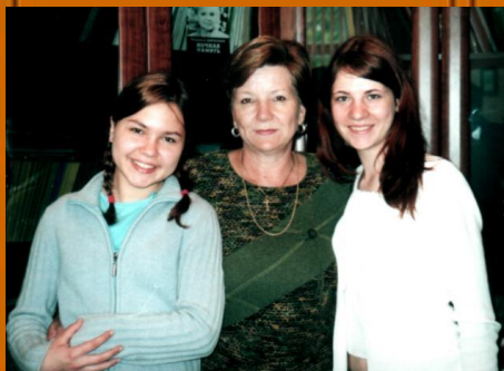
директор гимназии №3 2004 г.