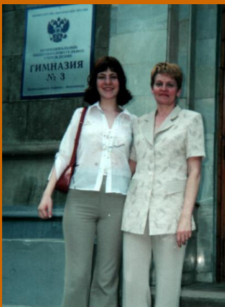
Автор с мамой, 2001 г.