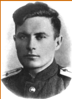
Лейтенант, 1944 г.