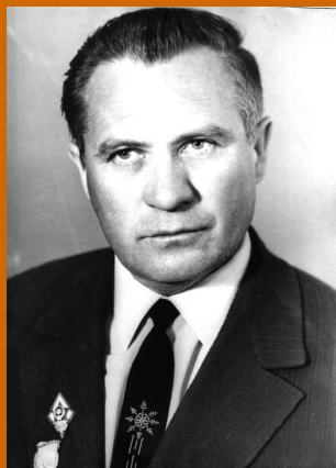
Учитель черчения, 1969 г.