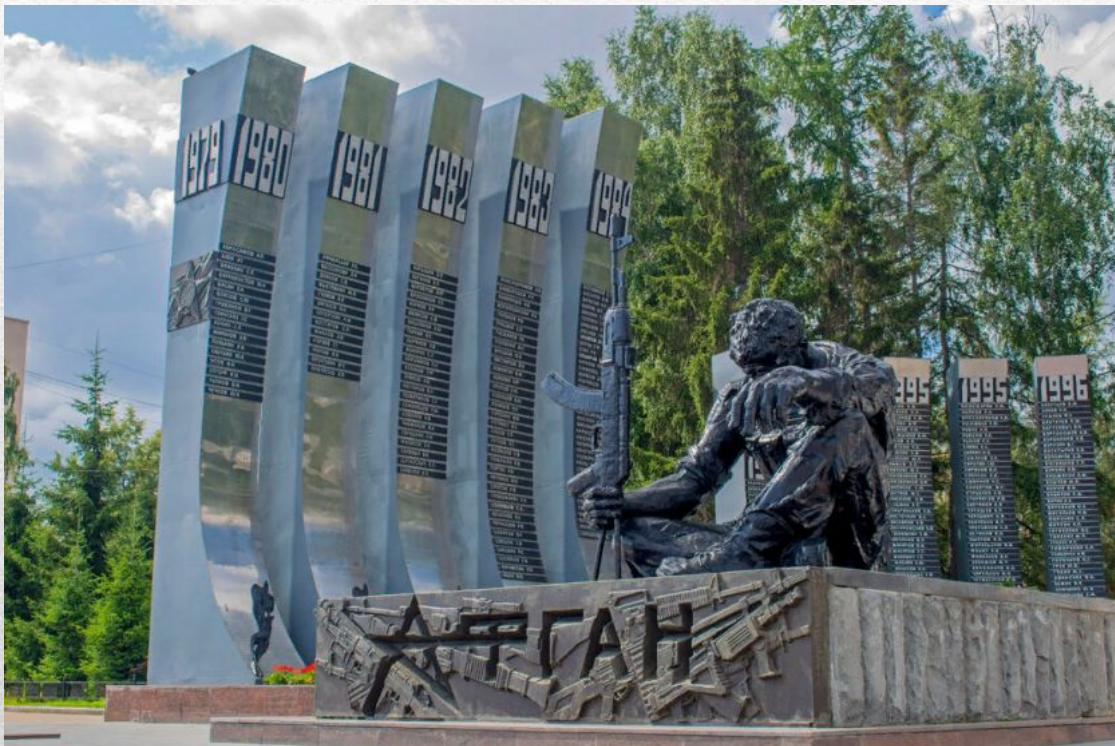
Памятник погибшим воинам-афганцам.