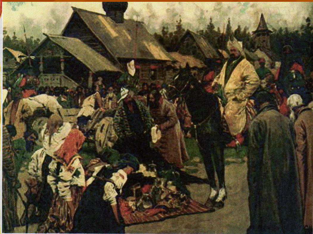
Установление системы баскачества