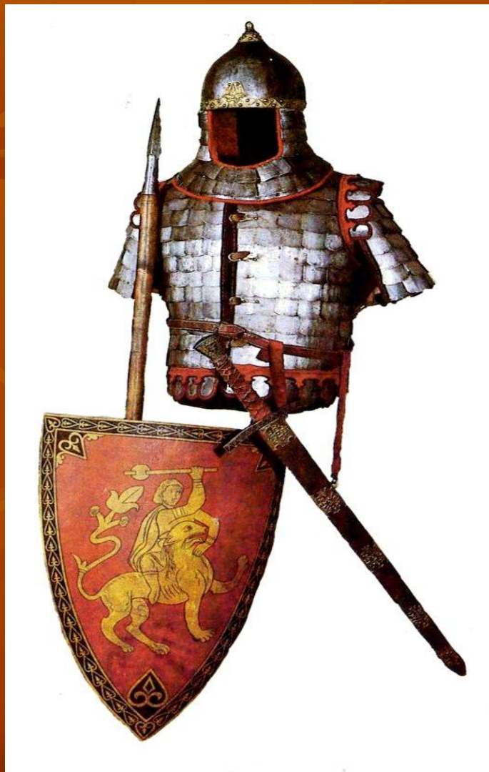
Старинный герб Москвы