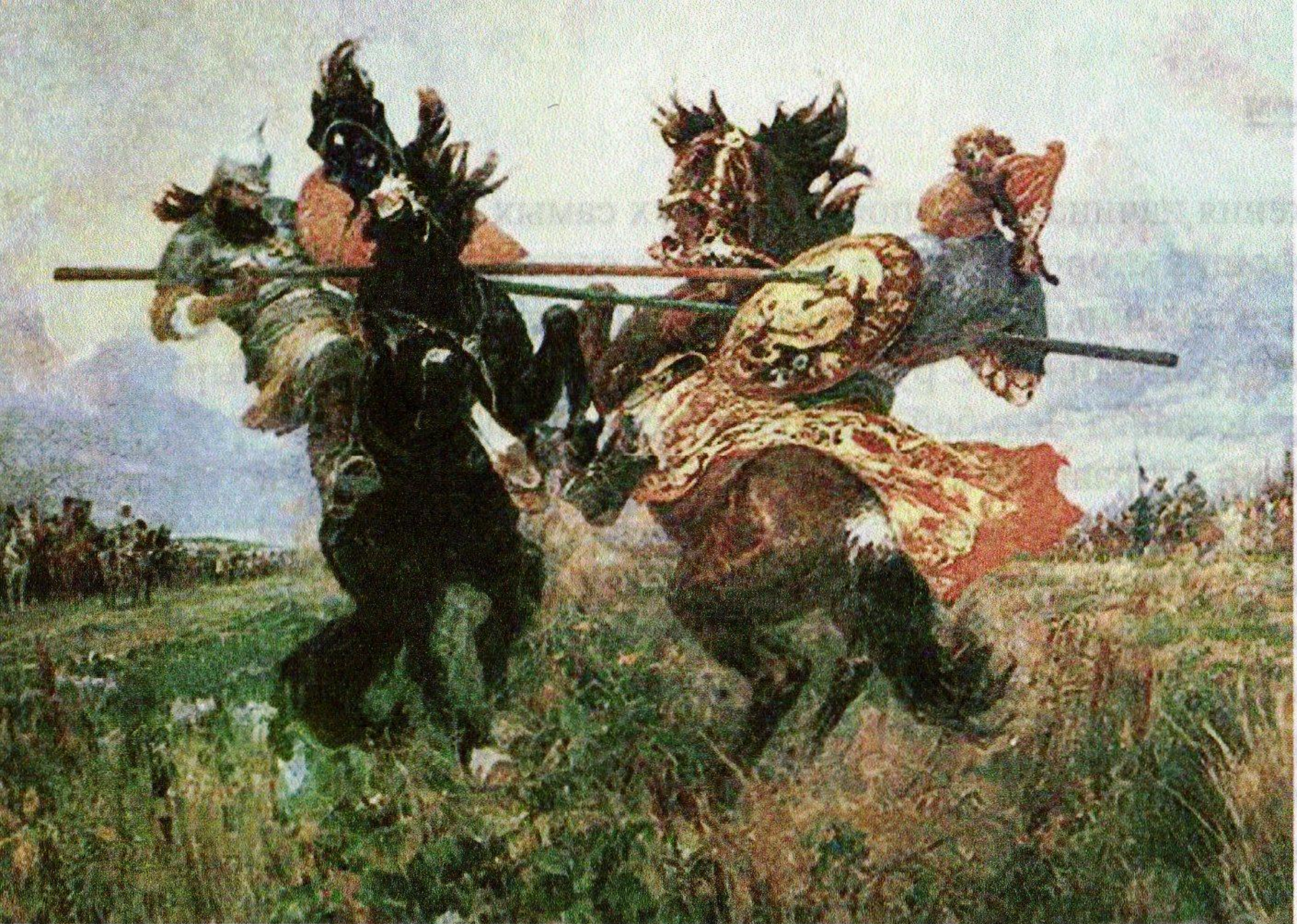
Поединок Пересвета с Челубеем