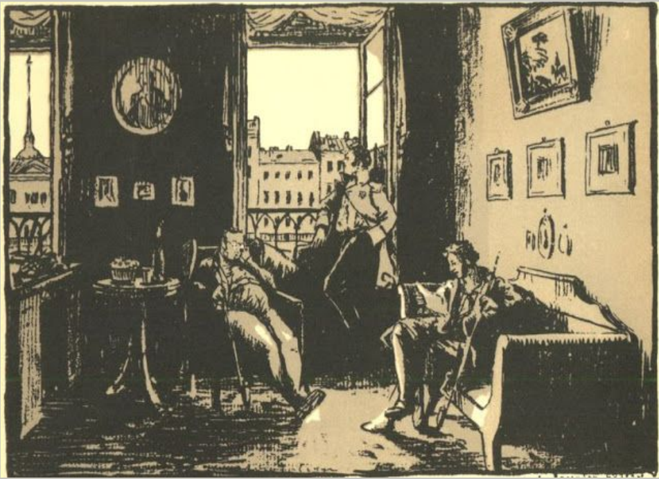
Иллюстрация Александра Бенуа к поэме "Медный всадник"