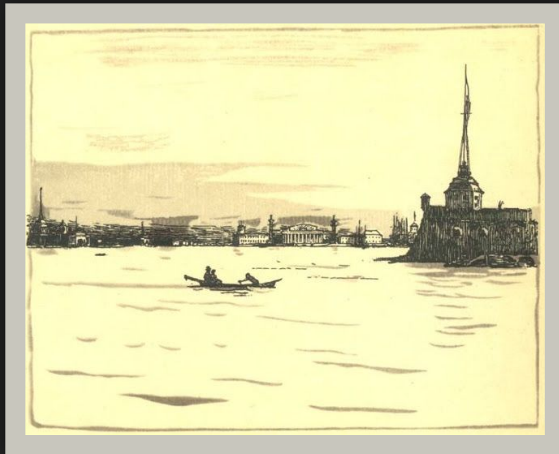
Иллюстрация Александра Бенуа к поэме "Медный всадник"

Поэма “Медный всадник” – живой образный организм, не терпящий однозначных толкований. Все образы здесь многозначны, символичны. Образы Петербурга, Медного всадника, Невы, Евгения имеют самостоятельное значение, но в рамках поэмы тесно взаимодействуют друг с другом. Историю и современность поэт объясняет через емкий и символический образ Петербурга. Поэма открывается “Вступлением”, в котором образ города занимает господствующее место. Петербург здесь – глубоко символический памятник плодотворности единства миллионов людей.