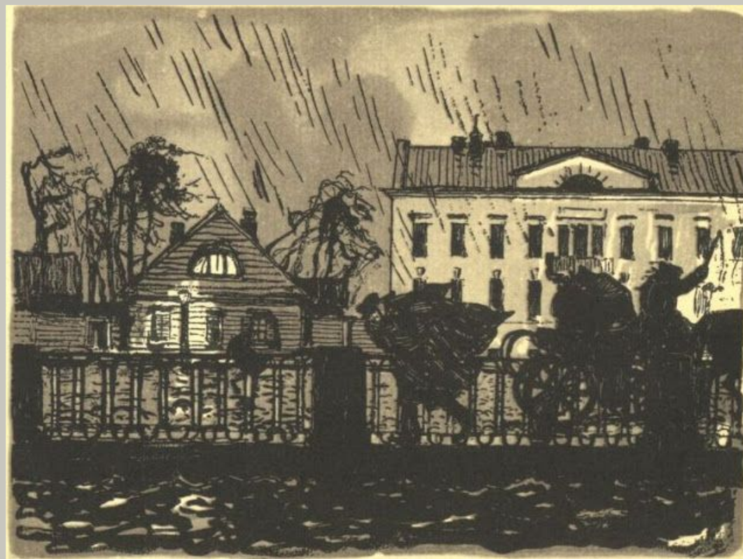
Иллюстрация Александра Бенуа к поэме "Медный всадник"

Но чем больше поэт говорит о пышной красоте города, тем больше создается впечатление, что он какой-то неподвижный, даже отчасти неестественный. Поэт видит “спящие громады пустынных улиц”, слышит “шипенье пенистых бокалов”, но людей на улицах нет, как нет и их лиц на фоне бокалов.