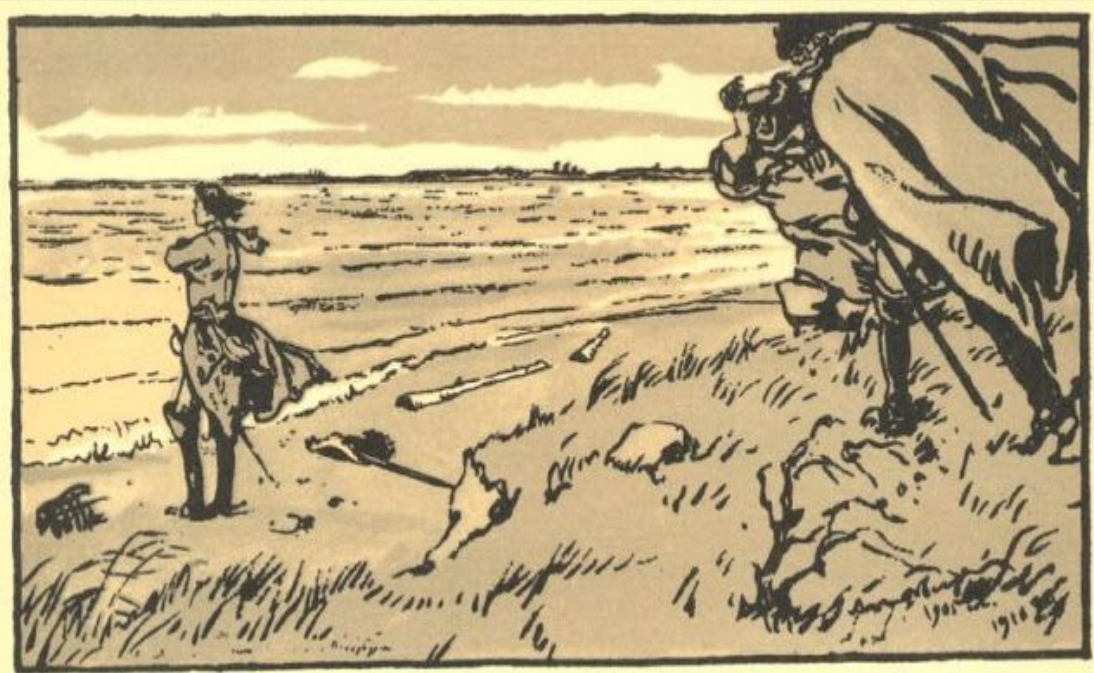
Иллюстрация Александра Бенуа к поэме "Медный всадник"

Петербург предстает как твердыня русского самовластья, как центр самодержавия, и он враждебен человеку. Столица России, созданная народом, обернулась враждебной силой для него самого и для отдельного человека. Пушкин как бы подчеркивает, что город, не возникший постепенно, не выросший из деревни, как подавляющее большинство других городов, а насильно построенный на этом месте вопреки плавному течению истории, если и будет стоять, то жителям его придется расплачиваться за то, что основатель практически пошел против законов природы.