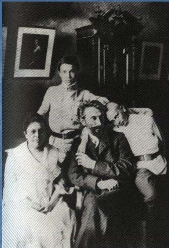
Борис Пастернак с родителями и братом Александром