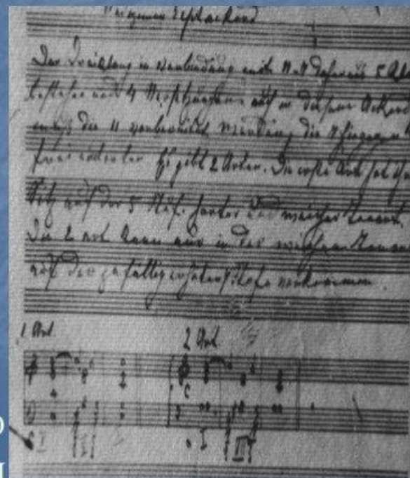
Нотный автограф Б.Пастернака. 1906 год