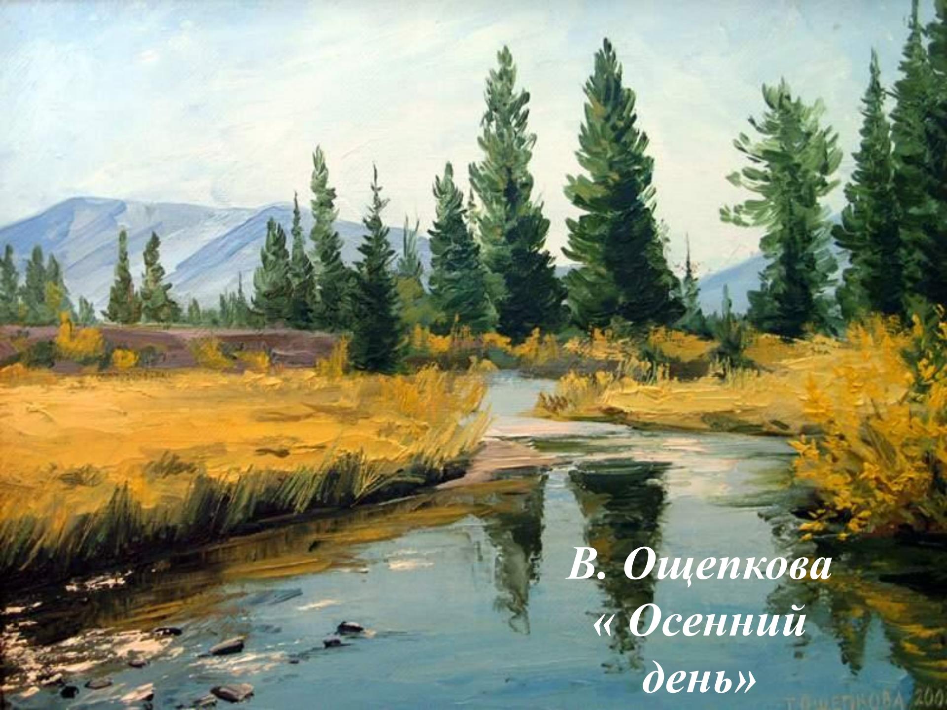
В. Ощепкова « Осенний день »