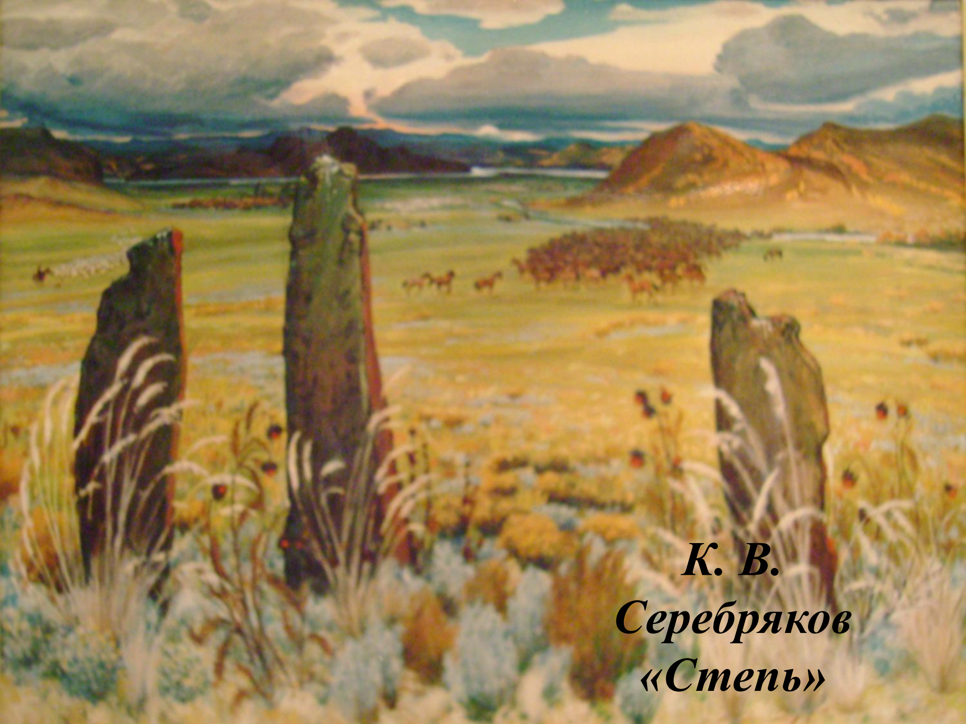
К. В. Серебряков «Степь»