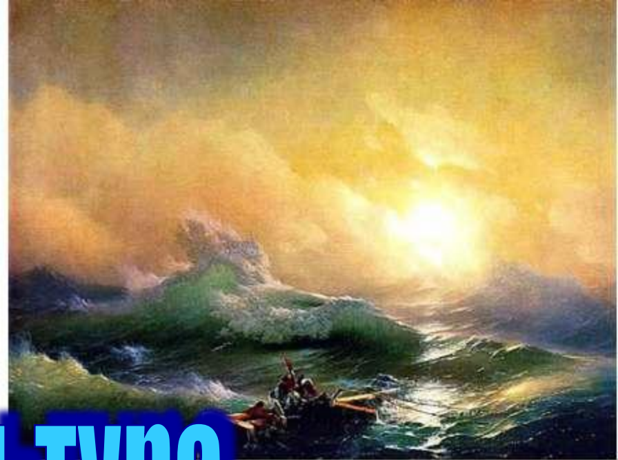
Илья Глазунов «Девятый вал»