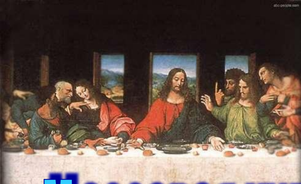
Леонардо да Винчи «Тайная вечеря»