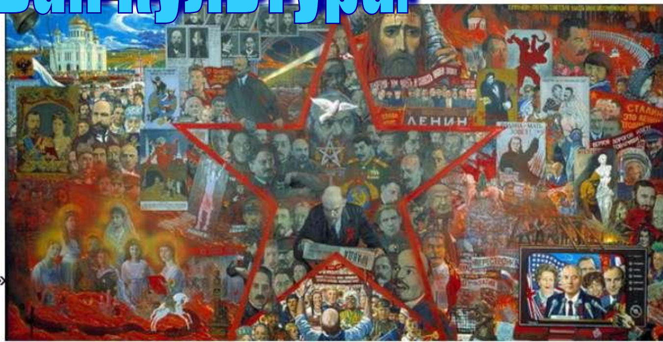
Илья Глазунов «Великий эксперимент»