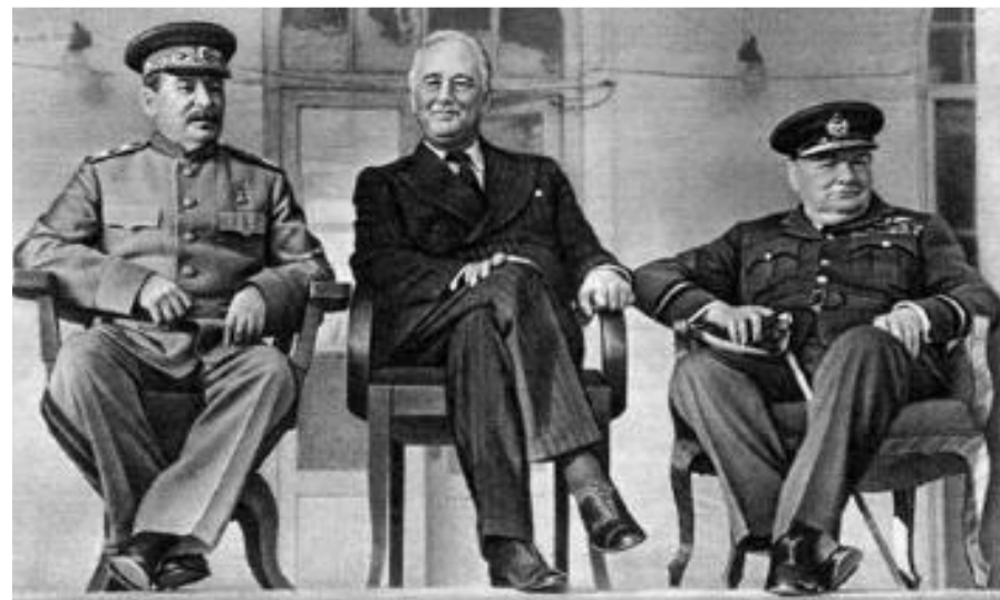
И.В.Сталин, Ф.Рузвельт, У.Черчилль.