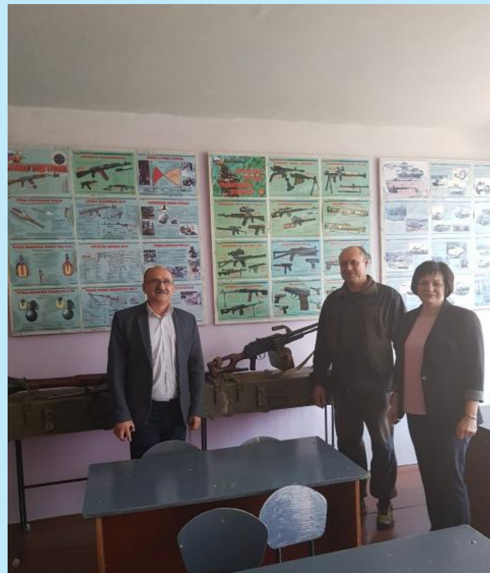
ЭККУРСИЯ ПО МКОУ СОСНОВСКАЯ СРЕДНЯЯ ШКОЛА