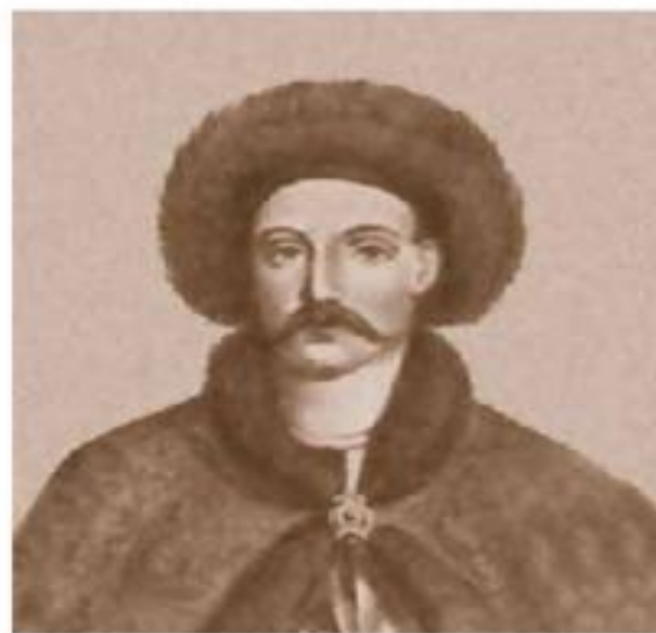
Всеволод в Переяславле