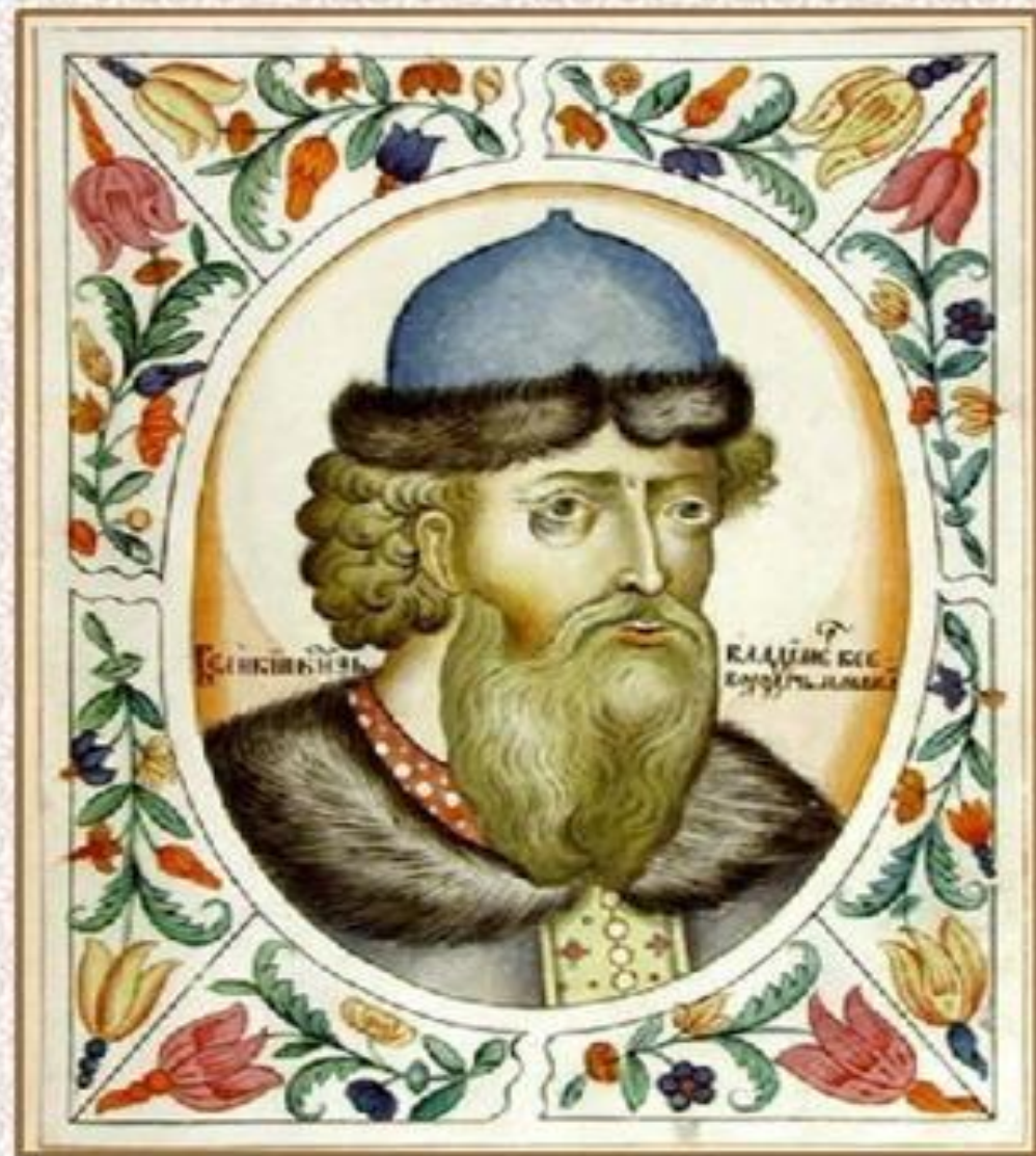
Великий князь Владимир Всеволодович Мономах. Портрет из Царского титулярника. 1672