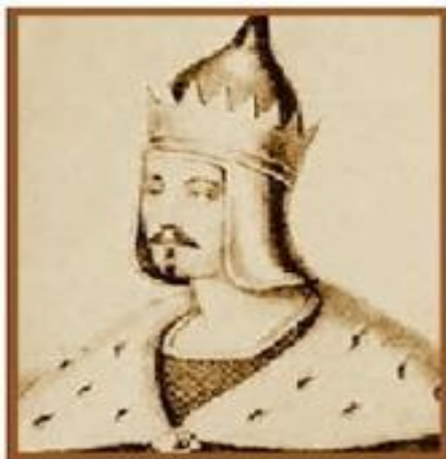
Изяслав в Киеве