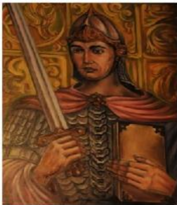
Святослав в Чернигове