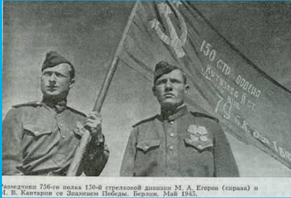
Разведчики 756-го полка 150-й стрелковой дивизии М. А. Егоров (справа) и И. В. Кантария со Знаменем Победы. Берлин. Май 1945.