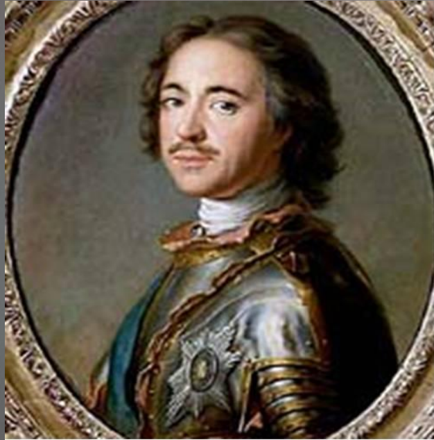
Пётр 1, русский царь

Соотношение воюющих сторон накануне битвы Шведская армия перед битвой: Численность - 37000 человек (30000 шведов, 6000 казаков, 1000 валахов). Орудия - 4 штуки Генералы - Карл 12, Реншильд Карл Густав, Левенгаупт Адам Людвиг, Роос Карл Густав, Мазепа Иван Степанович. Русская армия перед битвой: Численность - 60000 человек (52000 русских, 8000 казаков) - по некоторым данным - 80000 человек. Орудия - 111 штук Генералы - Петр 1, Шереметев Борис Петрович, Репин Аникита Иванович, Алларт Людвиг Николаевич, Меншиков Александр Данилович, Ренне Карл Эдвард, Баур Радион Христианович, Скоропадский Иван Ильич.