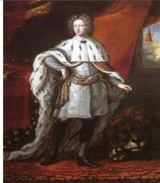
Карл XII, король Швеции