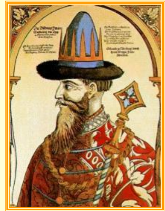
Иван Грозный. Миниатюра из «Титулярника»