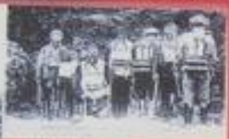
Первая группа заключенных.

Поминания о нацисте датируются серединой 19 столетия - как о нацисте №, или Рыковских рудниках, несколько лет спустя и гибели людей, в 1921 году шахта была закрыта.