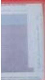
Шхера шхеры № 44bis «Каллиника».

№ 44 bis «Каллиника», расположенная на восточной окраине и, глубиной 365 метров, с поперечным сечением стала в 15 метров, особенно судбно-медицинской экспертизы, в ходе первого этапа нацисты после отступления немецко-финских захватчиков в 1943 году, став остров на протяжении 310 метров был застроен лагерем советских людей. Сюда было брошено более 75 тысяч. При заключении из шхеры 130 трупов некоторые были оживлены, остальные опознать не удалось ввиду того, что фашисты от ответственности и, чтобы скрыть следы злодеяний в шхеру бросали скую воду, которая ускоряла разложение трупов, при осуществлении акты был взорван фашистами.