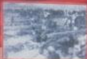
Останки трупов жертв, брошенные в шахту шахты.