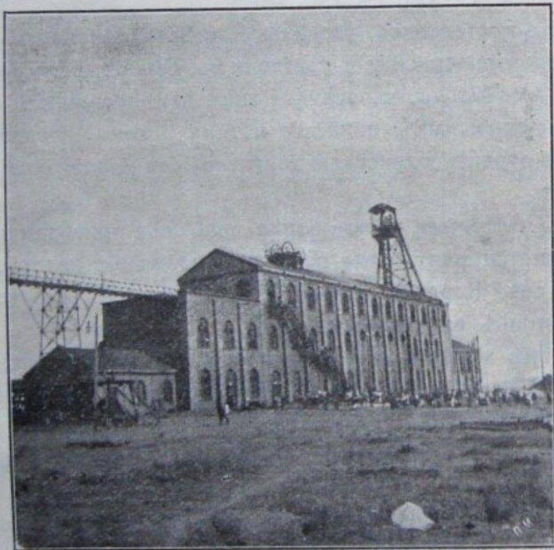
Рыковскій Макарьевскій рудникъ. Передъ рудникомъ ожидающая выноса труповъ. infodon.org.ua Донець: история, события, факты