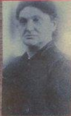
Бирта Вольдем Утен Сброшена в шурф в мае 1942 г.