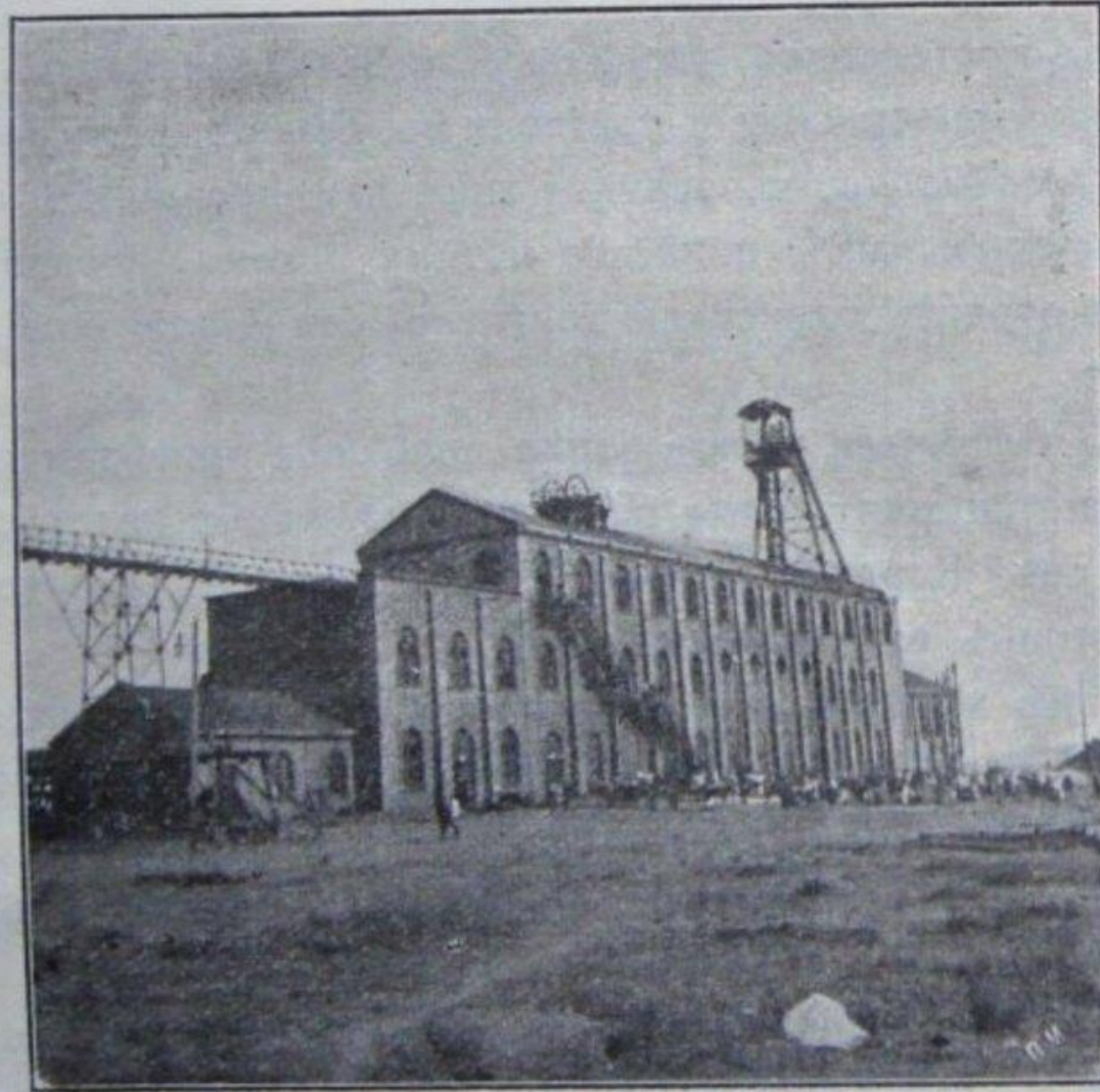
Рыковскій Макарьевскій рудникъ. Передъ рудникомъ ожидающая выноса труповъ. infodon.org.ua Донець: история, события, факты