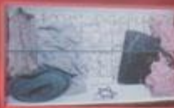
Вещи жертв, найденные после отхода нацистов.