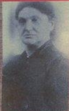
Бирта Вольдем Ууси Сброшена в шурф в мае 1942 г.