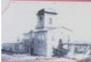
Поселение на острове шхеры в 1943 году.