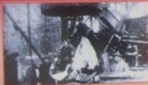
Поселение на острове шхеры № 44bis «Каллиника», 1943 год.