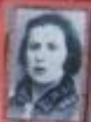
Портретная фотография жертвы, брошенной в шхеру.