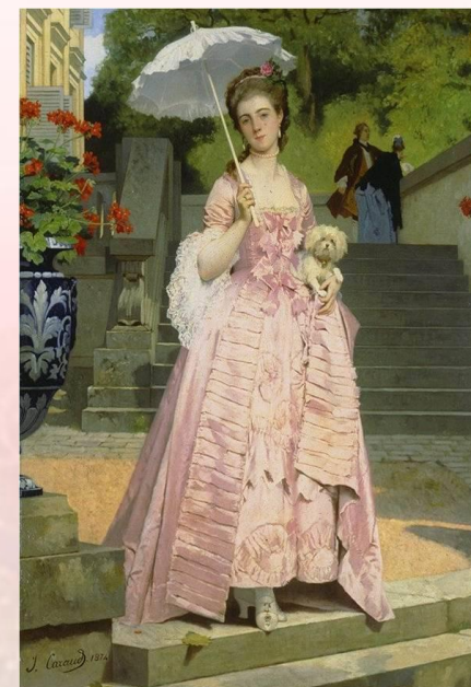
во весь рост