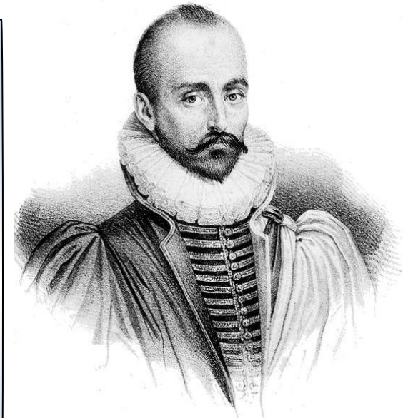
Мишель Эйкем де Монтень (1533-1592)

Ставил разум выше авторитета, обычая и «непреложных» истин. Теологию считал ложной наукой, закабеляющей разум. Отрицал бессмертие души и посмертное воздаяние. Поэтому после смерти Монтеня в 1676 г. было включено Ватиканом в индекс запрещённых книг.