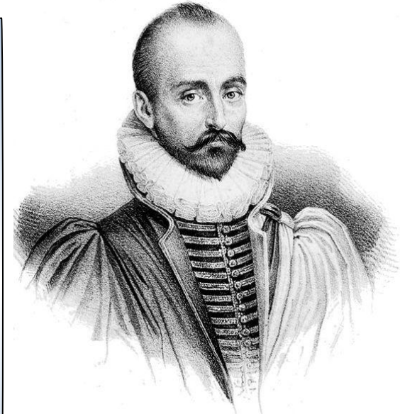
Мишель Эйкем де Монтень (1533-1592)

Ставил разум выше авторитета, обычая и «непреложных» истин. Теологию считал ложной наукой, закабеляющей разум. Отрицал бессмертие души и посмертное воздаяние. Поэтому после смерти Монтеня в 1676 г. было включено Ватиканом в индекс запрещённых книг.