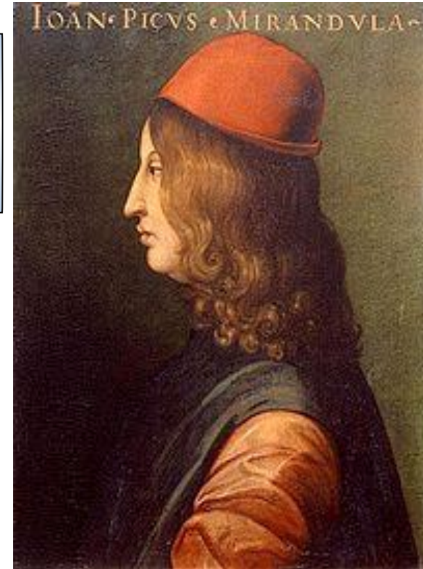
ПИКО ДЕЛЛА МИРАНДОЛА (1463-1494)