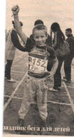
Разминка бега для детей