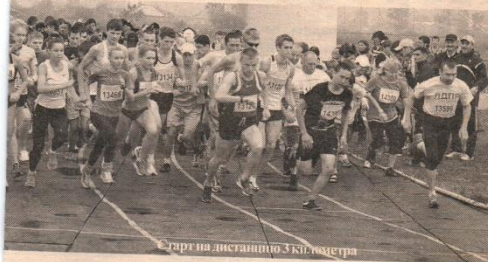
Старт на дистанцию 3 км. марафона