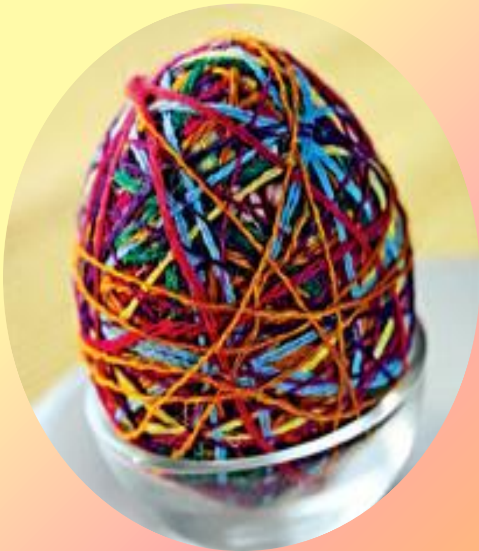
Яйцо из НИТОК