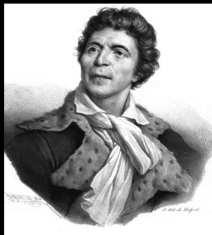
Жан Поль Марат