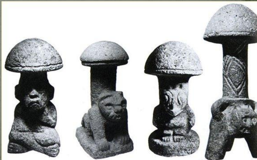
Various Mushroom Stones (approx 1 ft tall - 1000 B.C. to 500 A.D.)

В Гватемале обнаружены капища возрастом более 2500 лет с изваяниями магического гриба с человеческим лицом. Ритуалы с использованием галлюциногенных грибов сохранились у центрально-американских племён вплоть до настоящего времени.