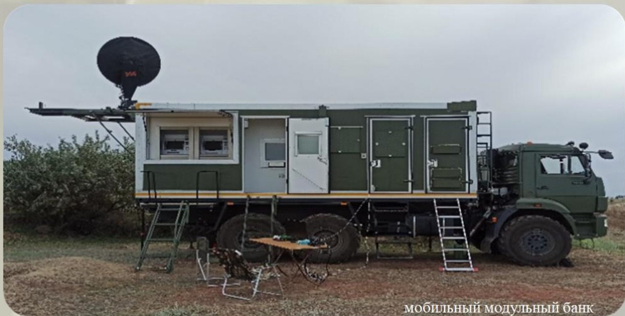
мобильный модульный банк