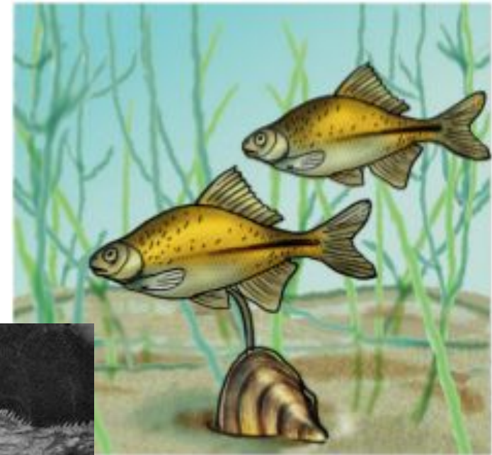
Рыба горчак и двустворчатый моллюск