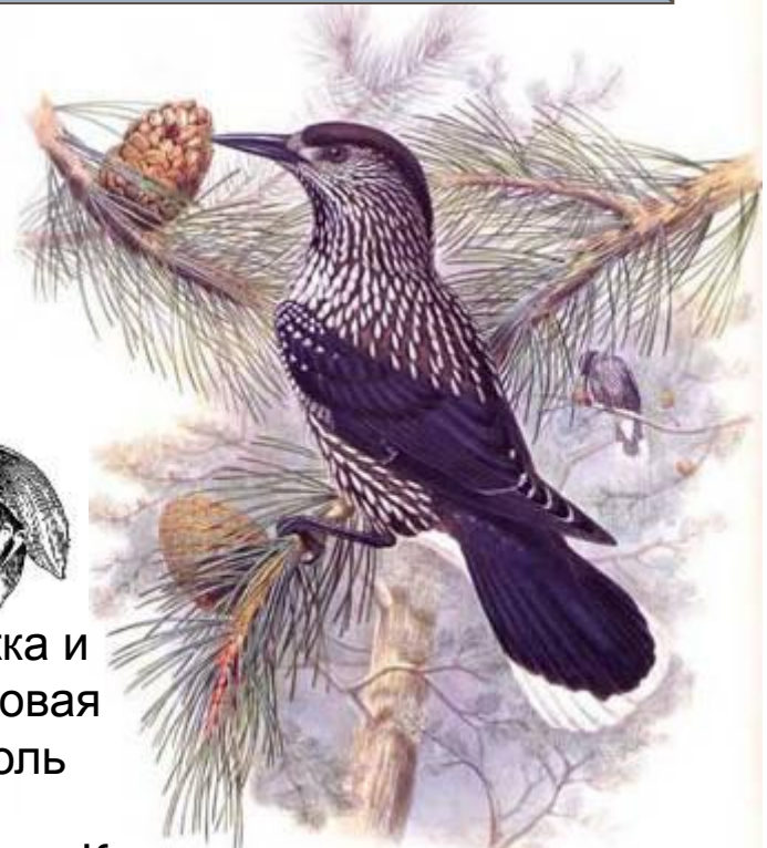
Кедровка и кедровая сосна