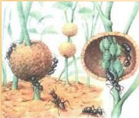
Тля и муравьи