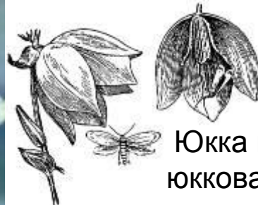
Юкка и юкковая моль