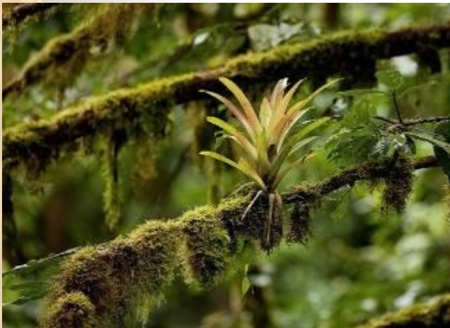
Буревестник и гаттерия в одной норе

Использование одними видами жилища других видов