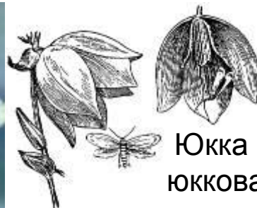
Юкка и юкковая моль