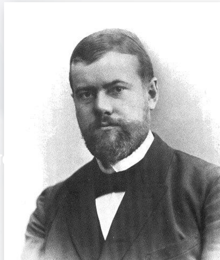
Макс Вебер (1864-1920), немецкий социолог, один из основоположников социологии