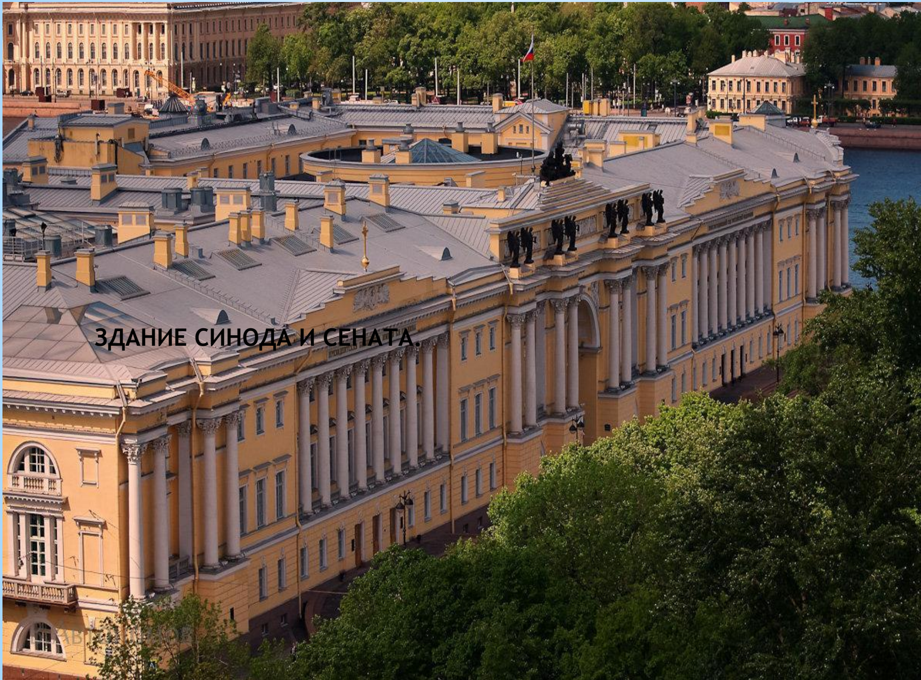
ЗДАНИЕ СИНОДА И СЕНАТА.