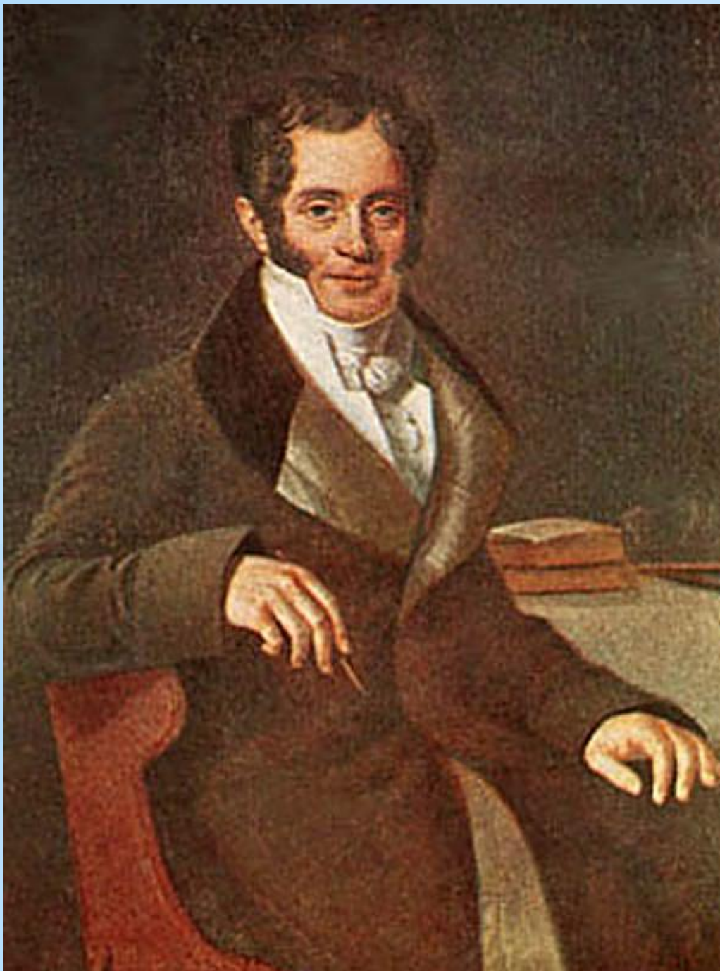
КАРЛО РОССИ (1775 - 1849) РОССИЙСКИЙ АРХИТЕКТОР ИТАЛЬЯНСКОГО ПРОИСХОЖДЕНИЯ.