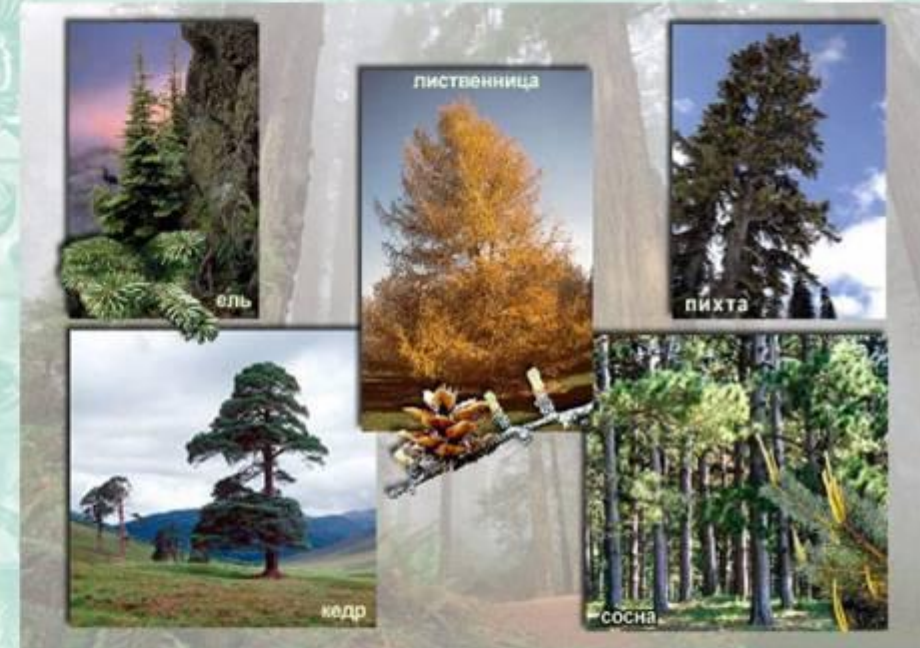
Растения-средообразователи экосистемы тайги.

Чем выше видовое разнообразие сообщества, тем оно более устойчиво к внешним воздействиям, тем шире возможность его адаптации к постоянно меняющимся условиям жизни.