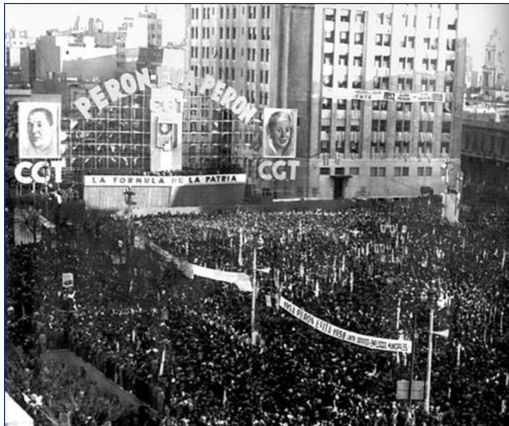
Диктатор Аргентины генерал Хуан Перон. 1946-1955 гг. 1973-1974