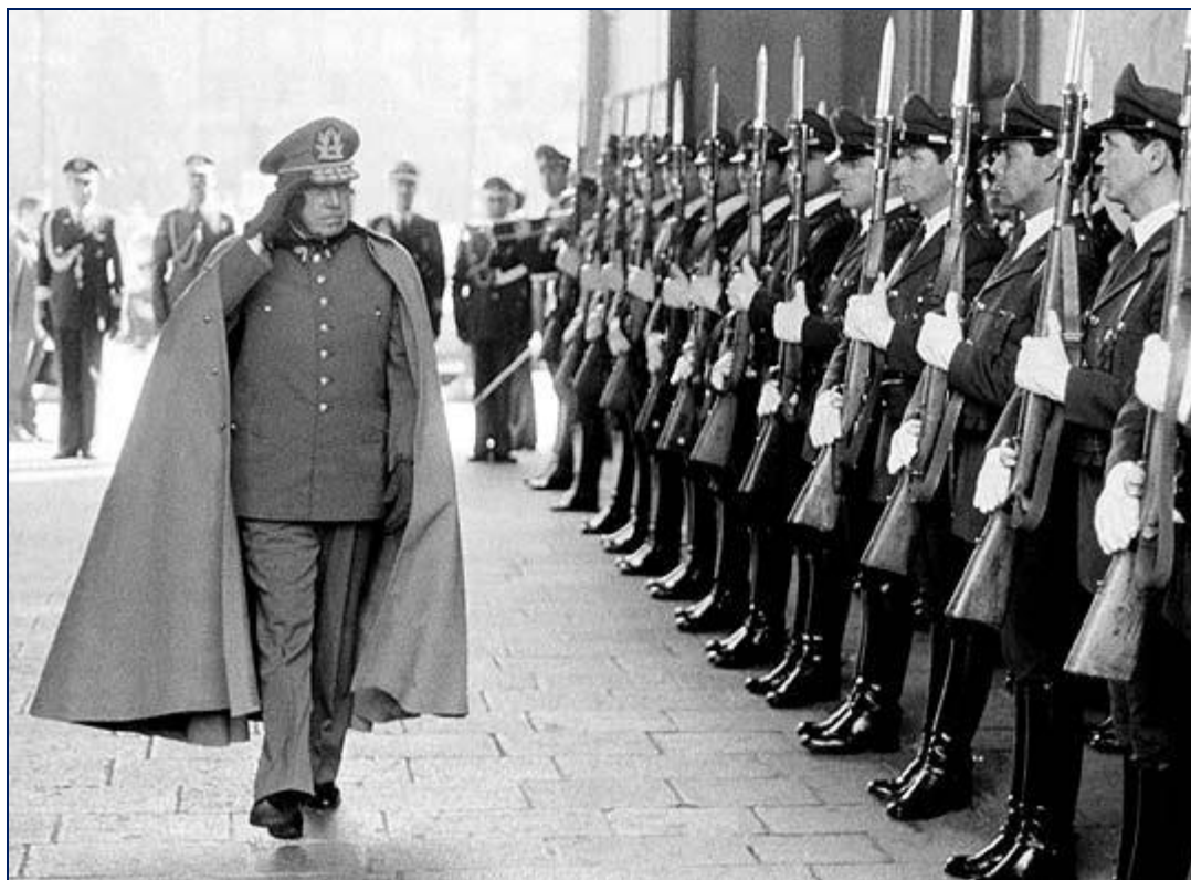
Диктатор Чили Аугусто Пиночет, 1973-1990 /1998/ гг.