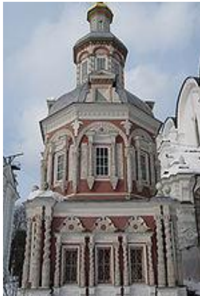
Успенский собор (1559)