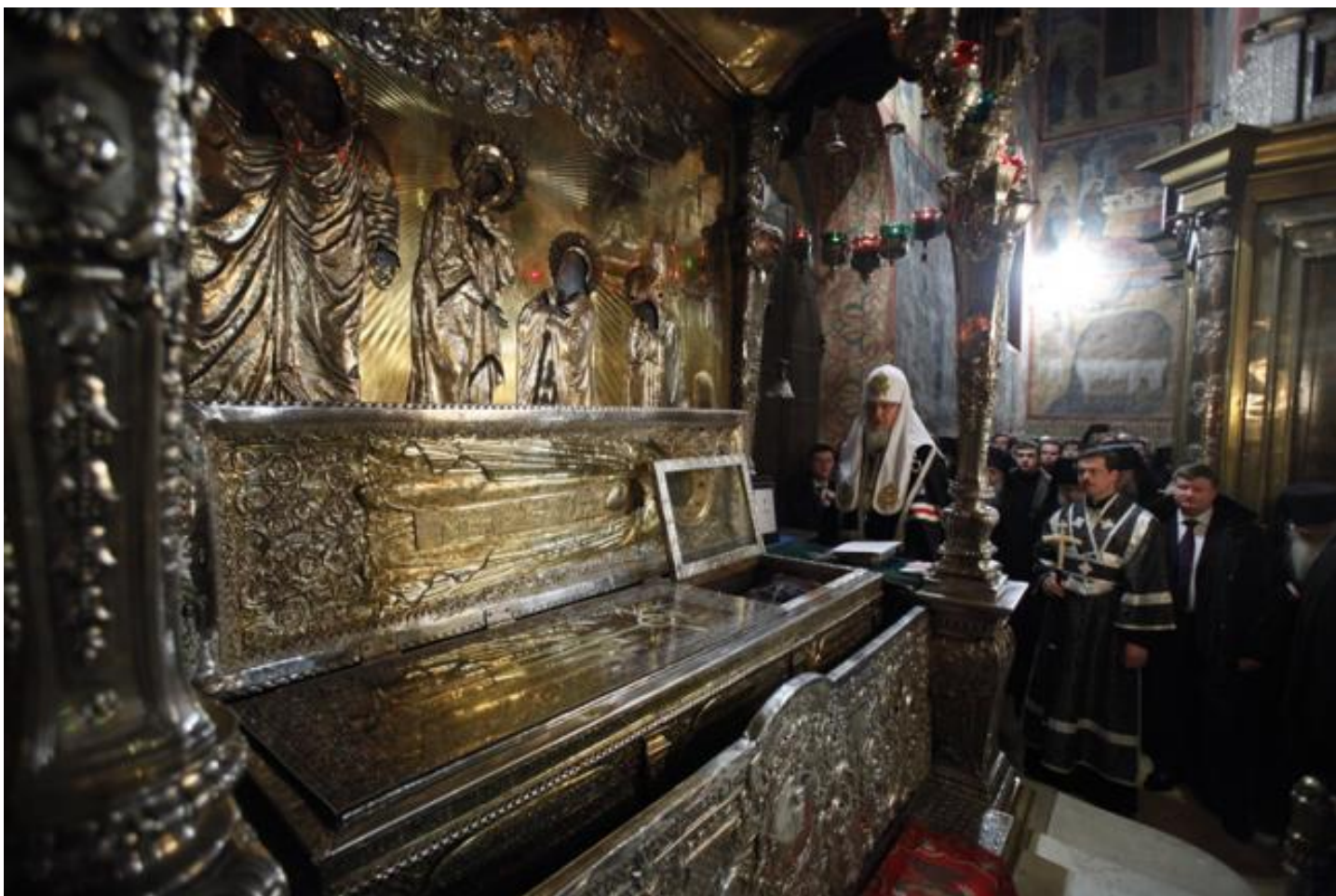
Молебен у мощей Сергия Радонежского в Троице-Сергиевой Лавре