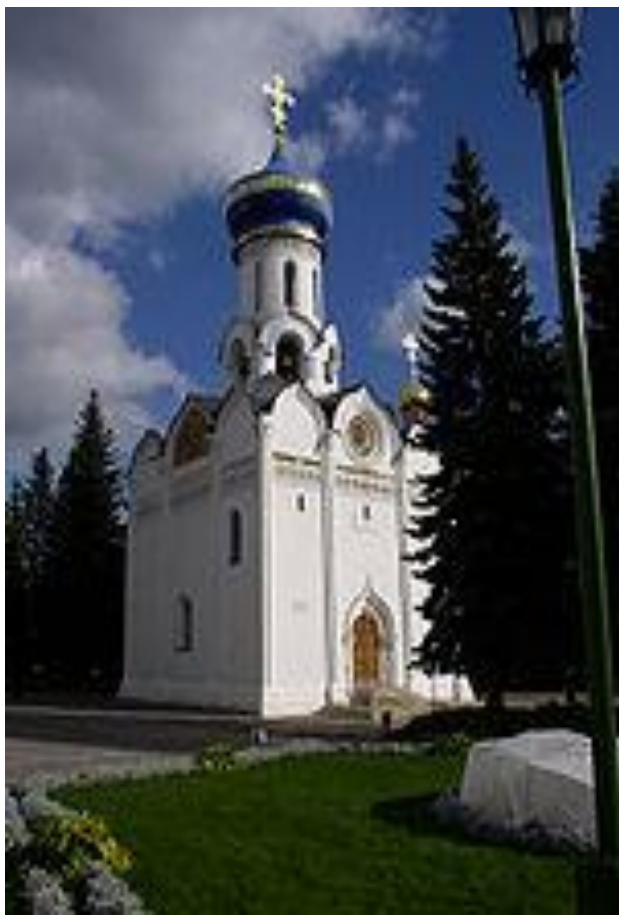
Духовная церковь (1476)