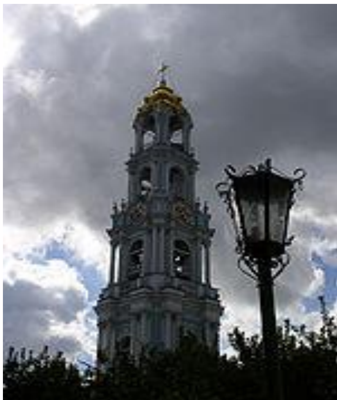
Уточья башня (1650)