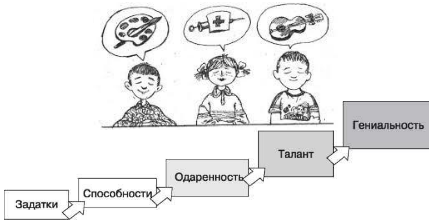
Рис. 27.7. Уровни развития способностей