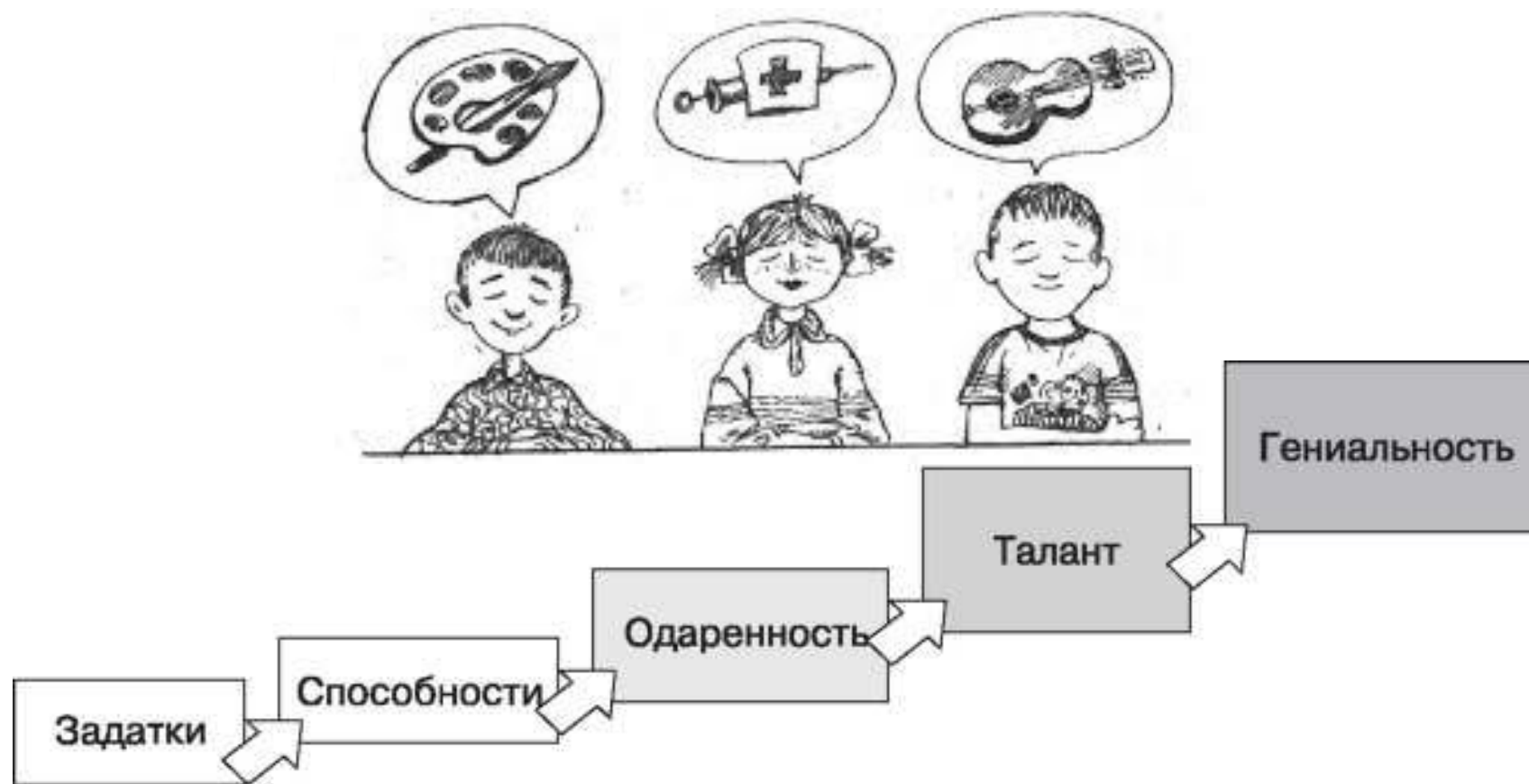
Рис. 27.7. Уровни развития способностей