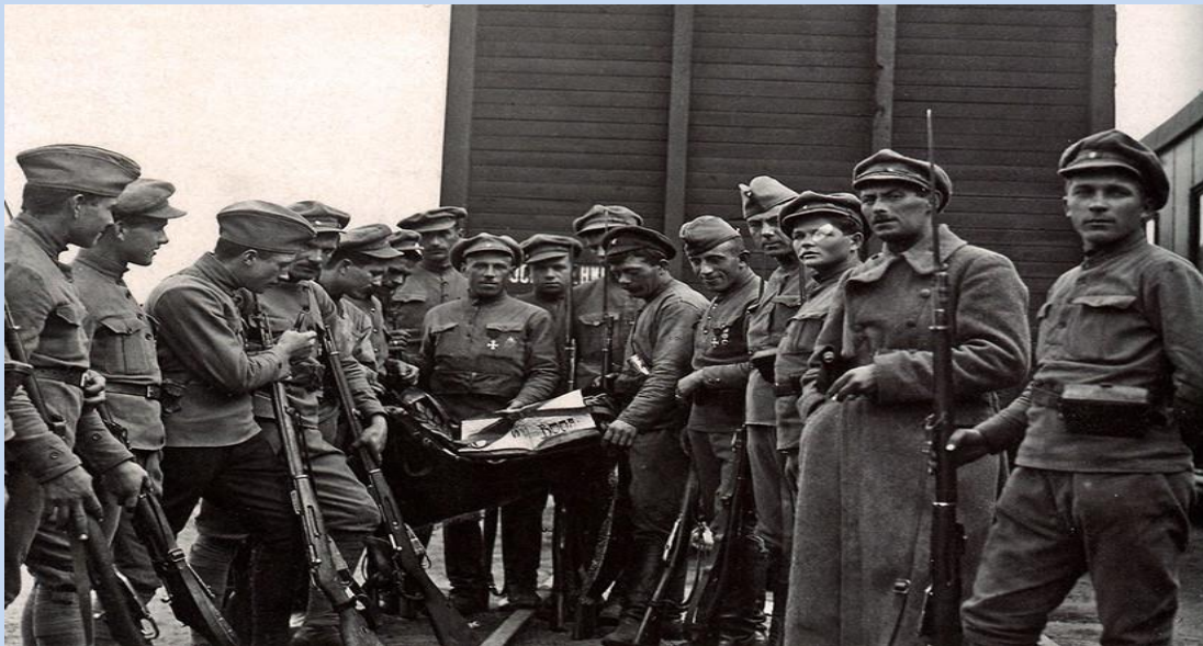
Азамат соғысы (1918-1920 ж.ж.)