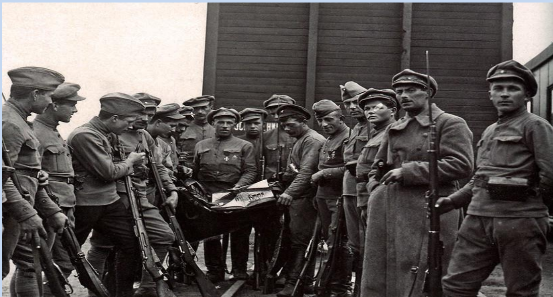
Азамат соғысы (1918-1920 ж.ж.)