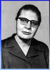
Светлой памяти Е.И. Никитиной посвящается...