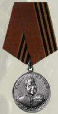
МЕДАЛЬ ОРДЕНА "ЗА ЗАСЛУГИ ПЕРЕД ОТЕЧЕСТВОМ" 1 И 2 СТЕПЕНИ