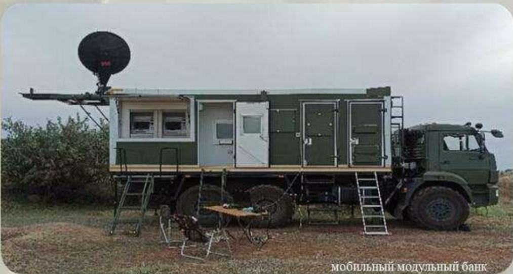
мобильный модульный банк