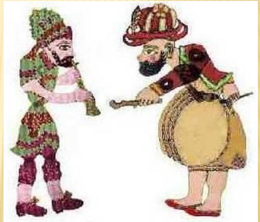
Хадживат (слева) и Карагёз (справа)

Карагёз ( тур. Karagöz, буквально — чёрноглазый), 1) персонаж турецкого теневого театра , воплощение народного юмора , природной смекалки. 2) Театр кукол в Турции , получивший наименование от главного героя представлений. Возник в XVI веке. Помимо основного персонажа, в представлении участвовали: партнёр Карагёза Хадживат, горожане, анатолийские крестьяне, плутоватый дервиш и др. Иногда представления театра отражали недовольство широких масс правительством и существующими порядками.