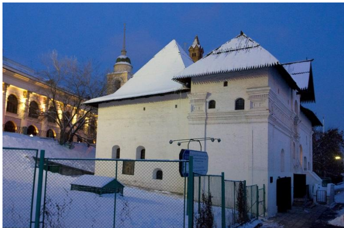
Старый Английский Двор в Москве