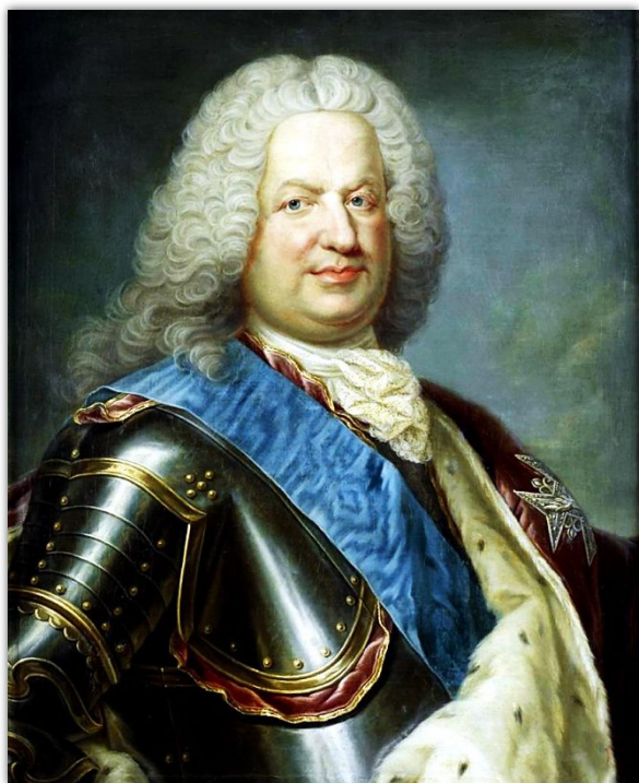
АВГУСТ III ставленник России