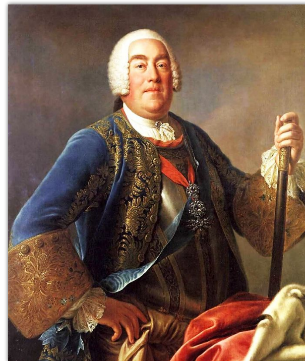
СТАНИСЛАВ ЛЕЩИНСКИЙ ставленник Франции

Между противоборствующими сторонами началась « война за польское наследство » ( 1733 по 1735 гг. ) По итогам войны королём Речи Посполитой был избран Август III. Россия сохранила влияние в Восточной и Центральной Европе.