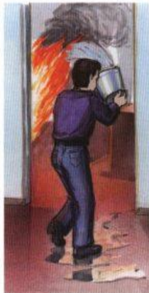
Приступить к тушению пожара первичными средствами