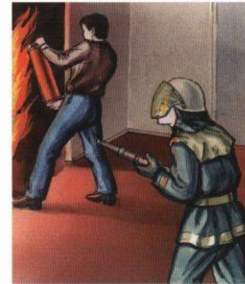
Прибывшие пожарные подразделения включаются в работу