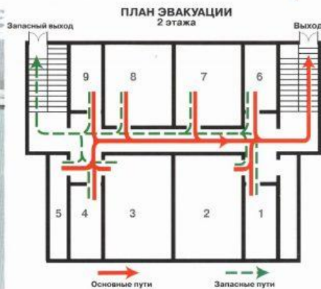
Задействовать план эвакуации. Открыть запасные двери