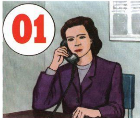
Сообщить о пожаре в пожарную охрану. Задействовать систему оповещения