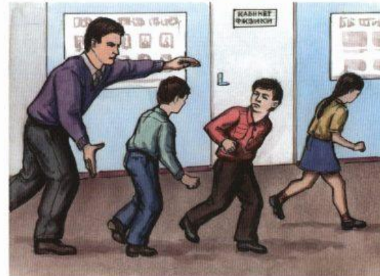
Вывести людей в безопасное место в соответствии с планом эвакуации. Проверить, все ли эвакуированы