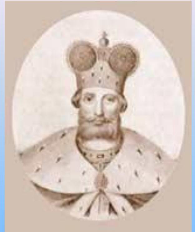
Ярослав II Всеволодович, отец Александра

родился в ноябре 1220 года (по другой версии 30 мая 1220 года) в семье князя Ярослава II Всеволодовича и рязанской княгини Феодосии Игоревны.