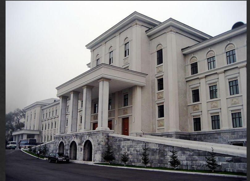
Государственный университет им. Ким Ир Сена

Первое высшее учебное заведение в КНДР – Государственный университет им. Ким Ир Сена в Пхеньяне – было открыто в 1946 г., (в 1970–71 учебный год около 16 тыс. студентов). В послевоенный период в высшей школе особое внимание уделялось техническим специальностям. В 1959 г. было открыто 15 высших учебных заведений, преимущественно технических. В 1960г. во втузах обучалось 53,4 % общего числа студентов. По постановлению пленума ЦК ТПК (1960г.) при крупных промышленных предприятиях, стройках, с.-х. кооперативах стали открываться высшие технические учебные заведения (дневные и вечерние). Большое развитие получило заочное обучение. В 1964–65 учебном году имелось 98 вузов с 185 тыс. студентов, а в 1970 г. – 129 вузов. Новые вузы открывались в провинциях с целью удовлетворения их потребностей в специалистах (каждая провинция имела с.-х., медицинский, педагогический, учительский институты, институт воспитателей, коммунистический университет).