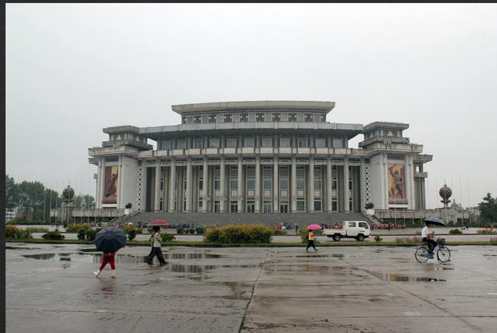
Хамхынский Большой Театр — один из самых крупных в КНДР, построенный в 1984 году.

В КНДР существует развитая киноиндустрия, производящая кинофильмы в духе «социалистического реализма с корейской спецификой». Производятся и мультипликационные фильмы. Литература и музыка являются ещё одним способом выражения государственной идеологии. Серия исторических романов «Бессмертная история» изображает героизм и трагедию периода, когда Корея находилась под властью Японии. Корейская война — тема таких литературных произведений как «Корея сражается» и «Пылающий остров». Начиная с конца 1970-х годов пять «великих революционных пьес» стали прототипом партийной литературы: «Святыня для опекунского божества», театральное исполнение таких литературных произведений как «Цветочница», «Трое мужей», «Одна партия», «Письмо от дочери» и «Негодование на мировой конференции». Кино признано как «наиболее мощная среда для просвещения народных масс» и играет главную роль в общественном образовании. По данным северокорейского источника: «фильмы для детей способствуют формированию подрастающего поколения со взглядом на создание нового человека: гармонично развитого и вооружённого самыми лучшими знаниями, придерживающийся мудрости „в здоровом теле здоровый дух“.» Один из наиболее влиятельных фильмов — «Ан Чунгын стреляет в Ито Хиробуми», повествующий о национальном герое, который убил японского генерал-резидента в Корею в 1909 году.