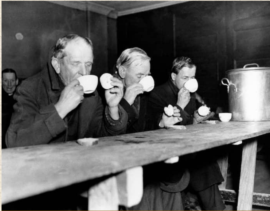
Безработные за обедом

Зарплаты уменьшились в три раза, а цены на одежду и еду наоборот выросли многократно.