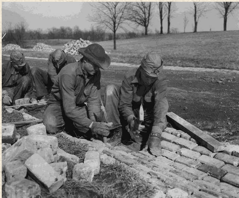
Рабочие строят дорогу

С приходом к власти Ф.Рузвельта правительство решилось на серьёзные меры: были созданы Федеральная корпорация страхования вкладов и Федеральная администрация чрезвычайной помощи. В задачи последней входили строительство, ремонт и улучшение шоссе и магистралей, общественных зданий и любых других государственных предприятий и коммунальных удобств. Для работ привлекались простые граждане, что обеспечило их заработком.