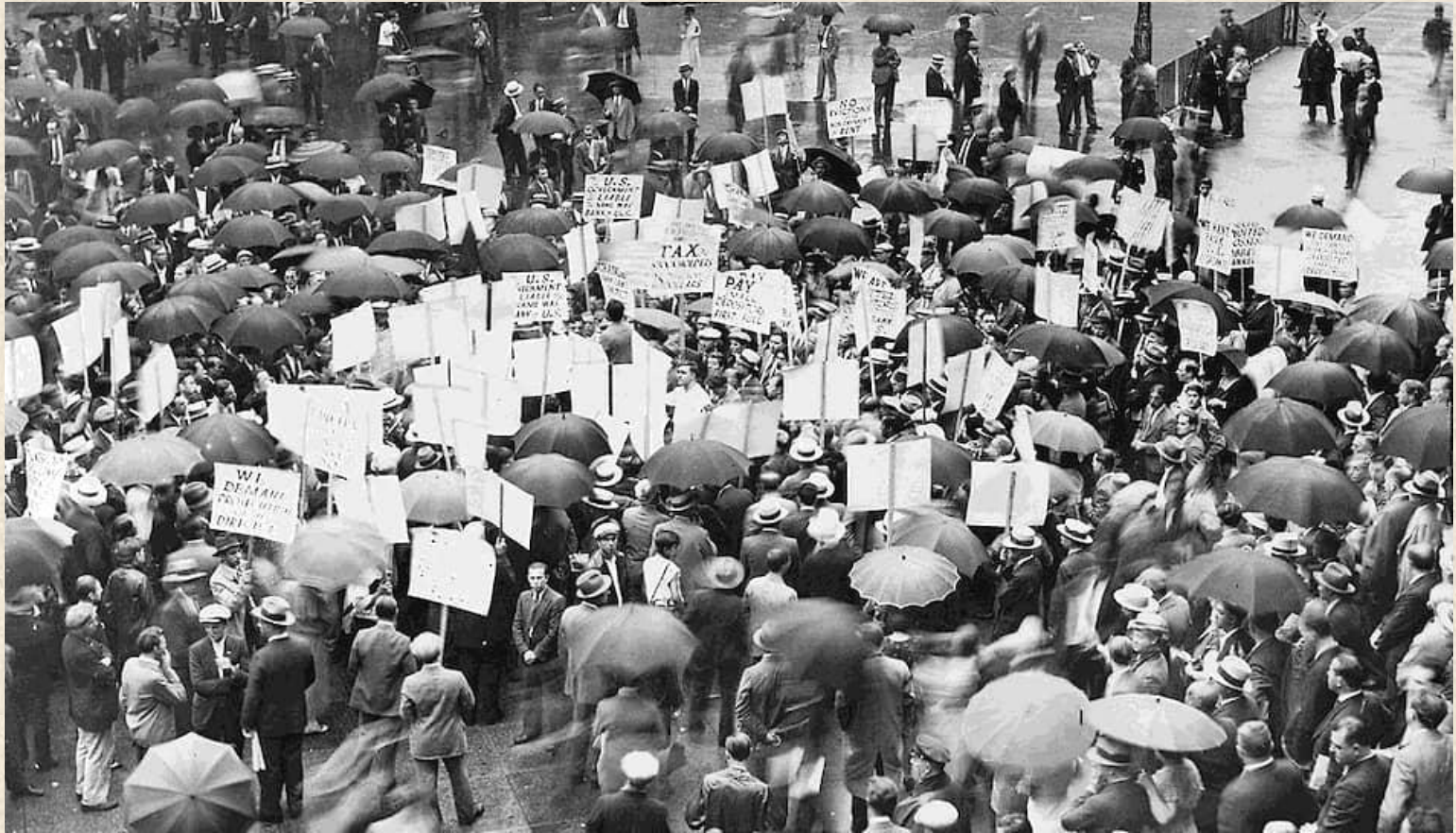
Толпы протестующих людей в Нью-Йорке

Самыми популярными фильмами были «Унесенные ветром», «Волшебник страны Оз» и «Кинг-Конг»