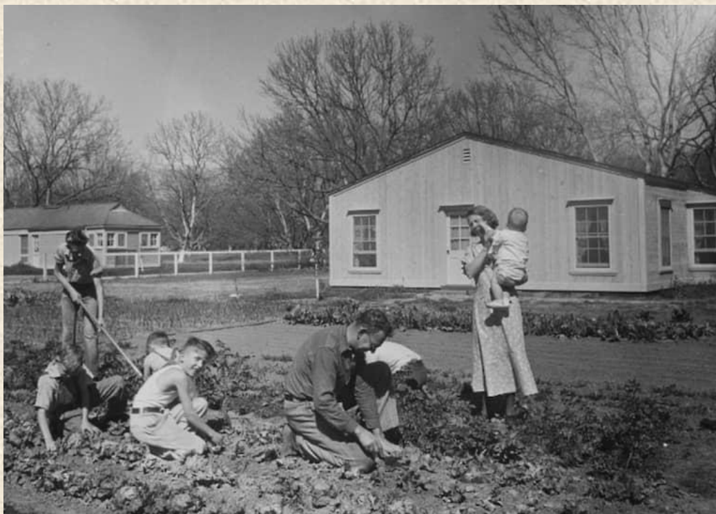
Семья из штата Калифорния

Ещё одной антикризисной мерой правительство было предоставление фермерам займов на льготных условиях. Этим правом воспользовались тысячи землевладельцев, получив ссуду на общую сумму $ 2,2 млрд.