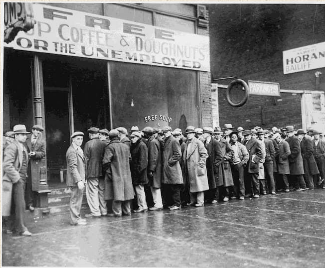
Витрина магазина с вывеской «Бесплатный суп, кофе и пончики для безработных»

За черным четвергом последовали черный понедельник и черный вторник, когда биржа потеряла более 14 млрд. Эта сумма превышала годовой федеральный бюджет в 10 раз.