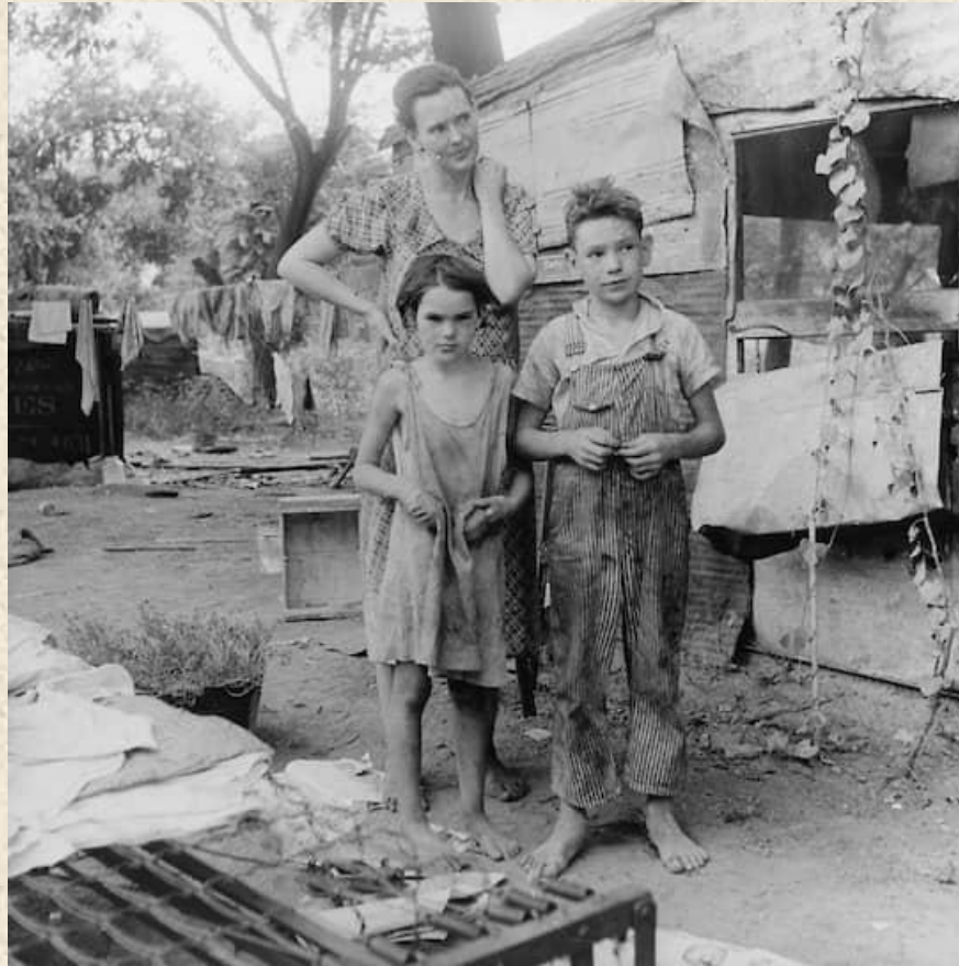
Жительница штата Оклахома со своими детьми

По данным статистики тех лет, 50% детей не получали достаточно еды, медицинской помощи или были лишены дома. Многие страдали рахитом. Рождаемость снизилась на 30%.