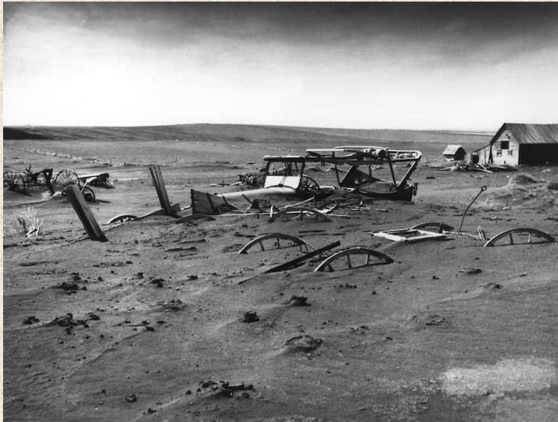
Ферма в штате Южная Дакота, погребенная под пыльной бурей

В период между 1930 и 1935 г. обанкротились или были распроданы с молотка примерно 750 тыс ферм. Великая депрессия совпала с серией многолетних и разрушительных пыльных бурь, которые усугубили экономическую и социальную ситуацию в стране.