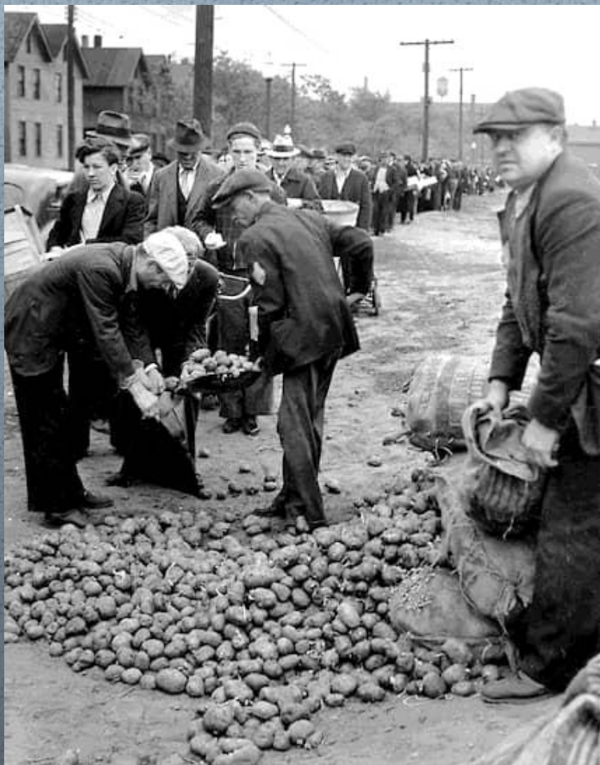
Людам раздают картофель

В основном под сокращение попало чернокожее население США. Но к 1931 г. увольняли всех, независимо от расовой или национальной принадлежности