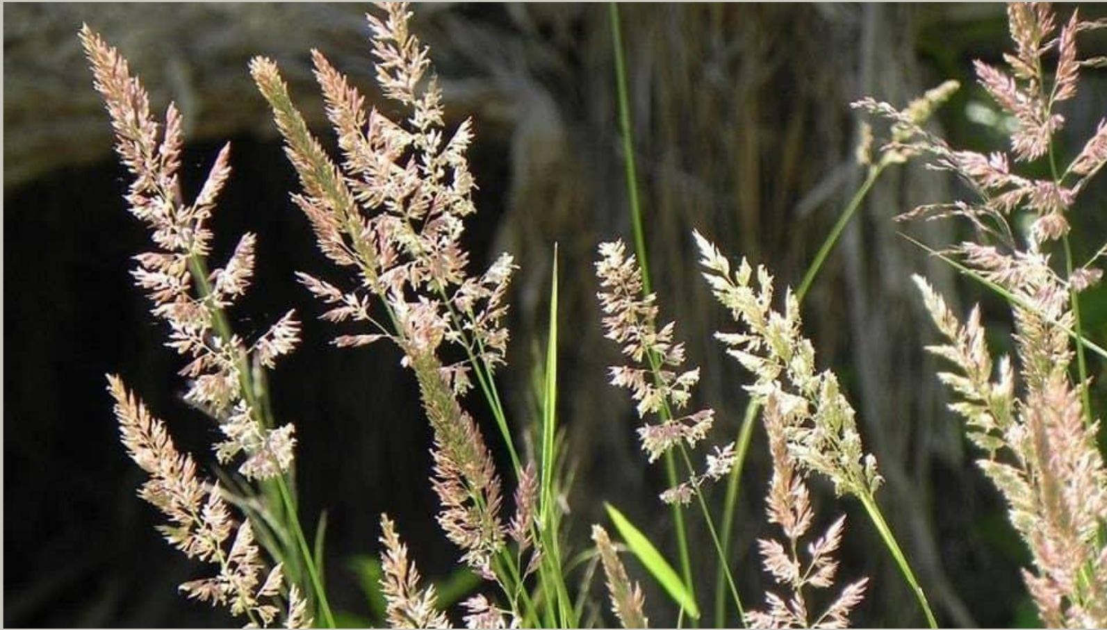
Костер безостый луговой

Растение занимает на лугах большие пространства, образуя заросли высотой до 1,5 метров. Стебель тонкий, листья узкие, от главного стебля отходят стебельки с колосками-соцветиями на конце, из-за этого растение похоже на овес.