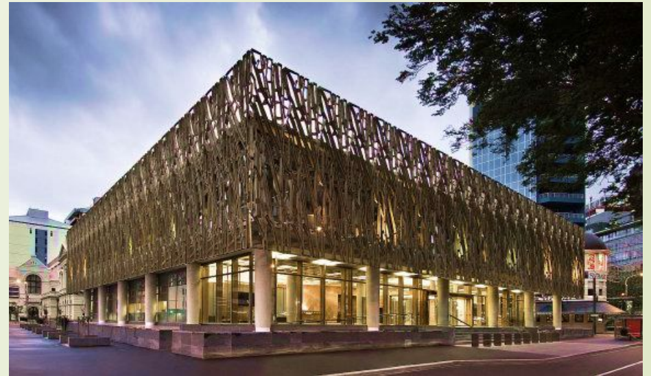
Здание Новозеландского Верховного суда