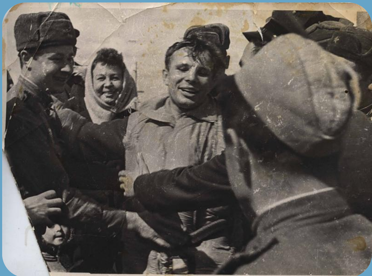
Юрий Гагарин в окружении первых свидетелей сразу после приземления

ПОСЛЕ СОВЕРШЕНИЯ ОДНОГО ОБОРОТА ВОКРУГ ЗЕМЛИ СПУСКАЕМЫЙ АППАРАТ КОРАБЛЯ СОВЕРШИЛ ПОСАДКУ НА ТЕРРИТОРИИ СССР. НА ВЫСОТЕ НЕСКОЛЬКИХ КИЛОМЕТРОВ ГАГАРИН КАТАПУЛЬТИРОВАЛСЯ И ПРИЗЕМЛИЛСЯ НА ПАРАШЮТЕ В 10 ЧАСОВ 55 МИНУТ В ТЕРНОВСКОМ РАЙОНЕ САРАТОВСКОЙ ОБЛАСТИ. ЛЕГЕНДАРНЫЙ ПОЛЕТ ПРОДОЛЖАЛСЯ 108 МИНУТ. С ТЕХ ПОР ИМЯ ЮРИЯ ГАГАРИНА, ЕГО УЛЫБКА ИЗВЕСТНЫ КАЖДОМУ ЧЕЛОВЕКУ.