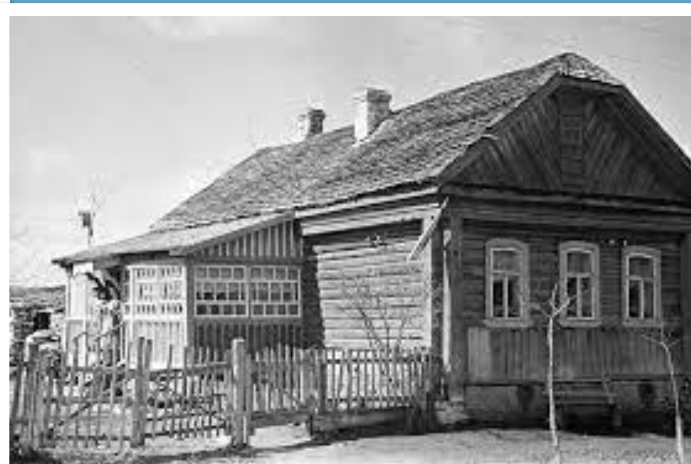
Родительский дом первого космонавта в Гжатске (г. Гагарин)