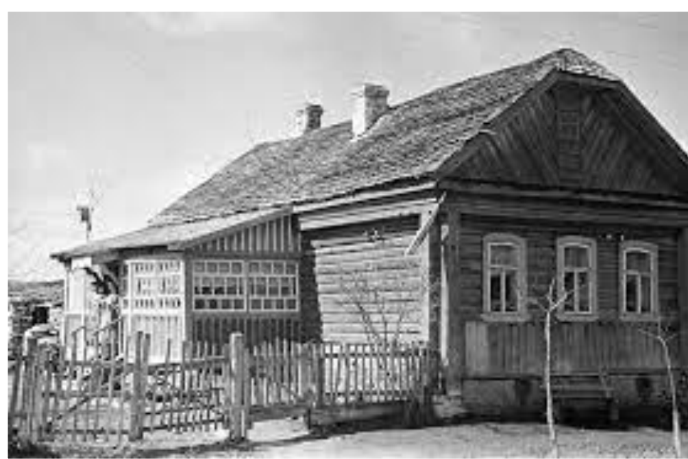
Родительский дом первого космонавта в Гжатске (г. Гагарин)