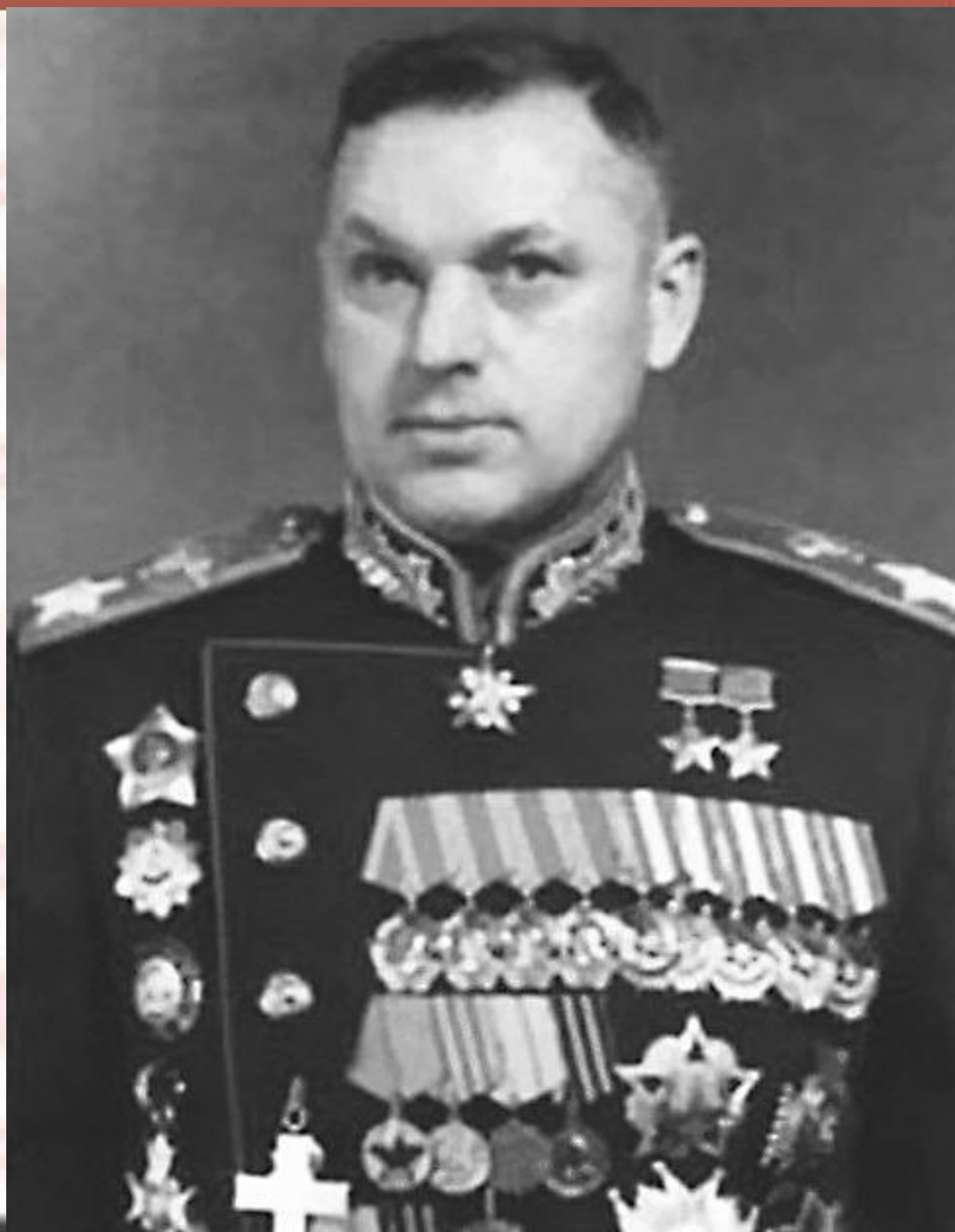
Рокоссовский Константин Константинович