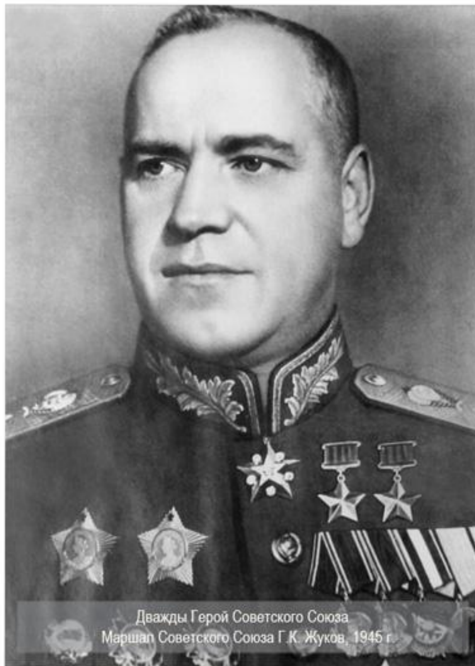
Дважды Герой Советского Союза Маршал Советского Союза Г.К. Жуков, 1945 г.